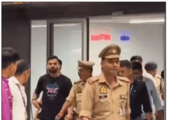
विराट कोहली लखनऊ एयरपोर्ट से कड़ी सुरक्षा के बीच बाहर निकले।