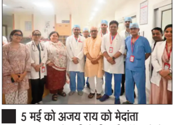
5 मई को अजय राय को मेदांता अस्पताल से छुट्टी दे दी गई, डॉक्टरों ने सावधानी और आराम की सलाह दी है।

लखनऊ। उत्तर प्रदेश कांग्रेस कमेटी के प्रदेश अध्यक्ष अजय राय को मंगलवार को मेदांता अस्पताल से छुट्टी दे दी। मंगलवार सुबह डॉक्टरों के राउंड के बाद उन्हें हॉस्पिटल से डिस्चार्ज करने की अनुमति दी गई थी। डॉक्टरों ने अगले कुछ दिनों के लिए उन्हें आराम करने की सलाह दी है। फिलहाल उनकी हालत स्थिर बताई जा रही है। इससे पहले 1 मई को शाम अचानक बेचैनी और ग्वरहाट के बाद बेहोश होने पर उन्हें मेदांता में भर्ती कराया गया था। शुरुआती हालत को देखते हुए डॉक्टरों ने उन्हें इमरजेंसी में भर्ती कर ICU में निगरानी में रखा था। अजय राय की अचानक तबीयत बिगड़ने के बाद वासगंसी से लेकर दिल्ली तक इसकी चर्चा रही। मेदांता में भर्ती होने के अगले ही दिन पीएम मोदी और राहुल गांधी ने सोशल मीडिया पर पोस्ट कर