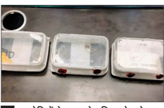
आरोपियों के पास से महिला से लूटे गए गहने बरामद हुए हैं।

हैं। ऐसे में सतर्कता और जागरूकता ही सबसे बड़ा बचाव है। पुलिस ने भी लोगों से अपील की है कि संदिग्ध गतिविधियों की तुरंत सूचना दें, ताकि समय रहते कार्रवाई की जा सके।