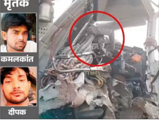
शनिवार की सुबह नौबस्ता एलिवेटेड पुल पर हुआ। इस हादसे के बाद हाईवे पर करीब दो किमी तक वाहनों की लंबी कतार लग गई।

कानपुर। कानपुर में मौरंग लदे खराब खड़े डंपर में पीछे से आ रहा डंपर का धुसा। टक्कर इतनी जोरदार थी की पीछे से टकराने वाले डंपर का केबिन चिपक गया। उसके केबिन में बैठे ड्राइवर और उसके हेलपर की मौत हो गई। दोनों सगे भाई थे। दोनों करीब 3 घंटे तक केबिन में फंसे रहे। सूचना पर पुलिस पहुंची। दोनों को निकालने की कोशिश की गई। लेकिन कामयाबी नहीं मिली। क्रेन मंगाना पड़ा। करीब तीन घंटे तक जिंदगी के लिए लड़ते हुए दोनों भाइयों ने दम तोड़ दिया। बाद में दो क्रेन की मदद से मौरंग लदे दोनों डंपर को आगे पीछे खींचने के बाद उनके शवों को बाहर निकाला जा सका। हादसा