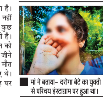
मां ने बताया- दरोगा बेटे का युवती से परिवर्ण इंस्टाग्राम पर हुआ था।