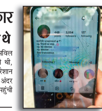
दरोगा को परेशान करने का जिस युवती पर आरोप लगा वह सोशल मीडिया पर काफी एक्टिव है। वह खुद को कवयित्री बताती है।