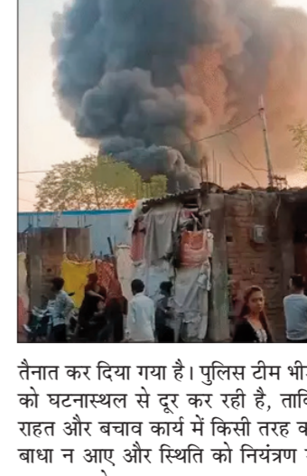
तैनात कर दिया गया है। पुलिस टीम भीड़ को घटनास्थल से दूर कर रही है, ताकि राहत और बचाव कार्य में किसी तरह की बाधा न आए और स्थिति को नियंत्रण में रखा जा सके।