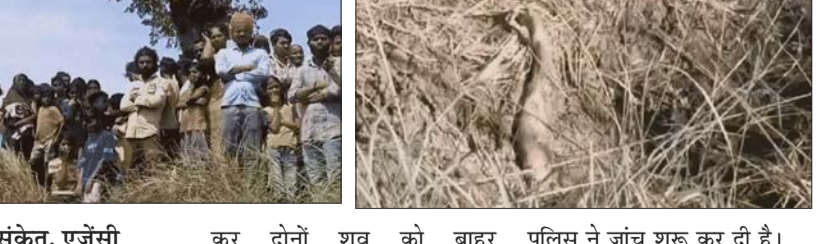
तमसा संकेत, एजेंसी

हाथ देखकर चिल्लाए लोग, जींस टॉप पहनी थी मां, ऑनर किलिंग की आशंका