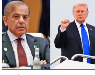
उन्होंने कहा कि पाकिस्तान का यह कदम ईरान को अमेरिकी नाकेबंदी से बचने में मदद देगा और वह अपना तेल व्यापार जारी रख सकेगा। उनके अनुसार, यह अमेरिका के साथ 'डबल गेम' जैसा है, जिससे दोनों देशों के रिश्तों पर असर पड़ सकता है।