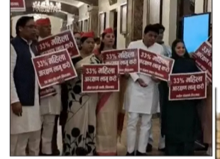
विधानसभा में सपा विधायकों ने प्रदर्शन किया। महिला आरक्षण लागू करने की मांग की।