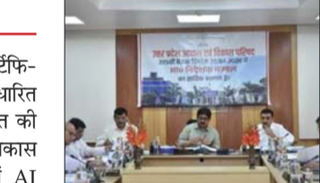
आवास विकास का 4173 करोड़ का बजट पास