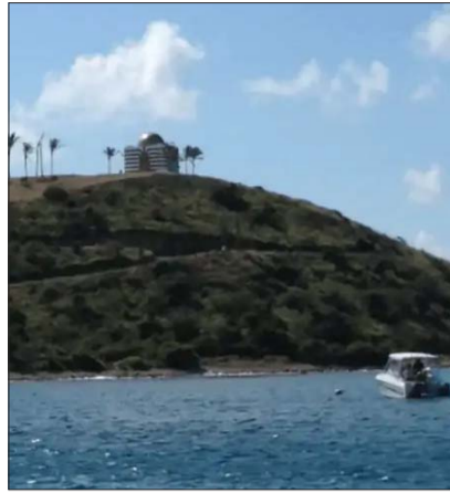
दूर से इमारत के ऊपर सुनहरा गुंबद दिखाई देता है।

करीब 2010 के आसपास, एपस्टीन की दोस्ती नॉर्वे के राजनयिक टेरेजे रोड-लार्सन से हुई। दोनों के बीच बिजनेस और अंतरराष्ट्रीय मामलों पर लगातार बातचीत होती रहती थी। 2016 के दौरान उनकी बातचीत में सऊदी अरब ज्यादा आने लगा, क्योंकि उस समय मोहम्मद बिन सलमान देश की तेल कंपनी अरामको को शेयर बाजार में लाने की तैयारी कर रहे थे। एपस्टीन चाहता था कि वह उनका फाइनेंशियल सलाहकार बने।