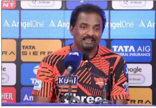
SRH के चीफ कोच मुरलीधरन की यह फोटो बुधवार को मुंबई इंडियंस और सनराइजर्स हैदराबाद के मैच के बाद प्रेस कॉन्फ्रेंस की है।

सनराइजर्स हैदराबाद के चीफ कोच मुथैया मुरलीधरन ने कहा कि गेंदबाजों को मान लेना चाहिए कि उन्हें मार पड़ेगी। उनके अनुसार खेल बल्लेबाजों के पक्ष में झुक चुका है, इसलिए गेंदबाजों को इस स्थिति के साथ खुद को ढालना होगा। उन्होंने बुधवार को मुंबई में सनराइजर्स हैदराबाद और मुंबई इंडियंस के बीच खेले गए मैच के बाद प्रेस कॉन्फ्रेंस में IPL में बल्ले और गेंद के संतुलन पर पूछे गए सवाल पर कहा कि यह टूर्नामेंट दर्शकों के मनोरंजन और स्पॉन्सरशिप के बिजनेस पर टिका है। उन्होंने कहा, 'अगर हम बॉलिंग फ्रेंडली विकेट देंगे, तो दर्शक इसे