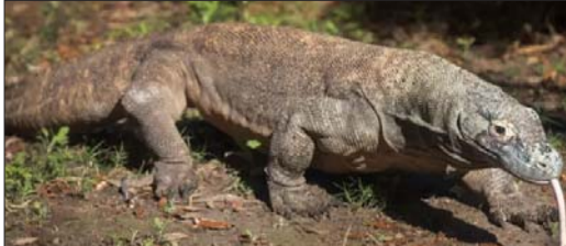
कोमोडो नेशनल पार्क और फ्लोरेस द्वीप के आसपास पाई जाती है। 2019 के आंकड़ों के अनुसार, इनकी संख्या करीब 3458 रह गई थी। ये जीव ईसावी गतिविधियों और जलवायु परिवर्तन के कारण खतरे में हैं। कई जगह इनके शिकार की कमी हो रही है, और कभी-कभी ईसावी के साथ संघर्ष में भी इनकी मौत हो जाती है।