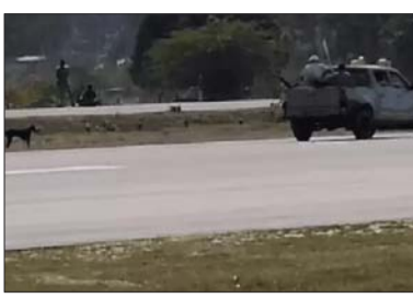
सुरक्षाकर्मियों ने कुत्ते को रनवे से भगाया था। (फाइल)

हवाई पट्टी पर उतरा। जिसमें सेना के अफसर और सैन्य सामग्री को ले जाया गया। भारतीय वायु सेना ने गगन शक्ति युद्धाभ्यास किया था। सबसे पहले सुखोई विमान ने 3.5