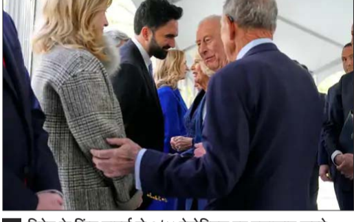
ब्रिटेन के किंग चार्ल्स से 9/11 मेमोरियल पर मुलाकात करते न्यूयॉर्क सिटी मेयर जोहरान ममदानी।

न्यूयॉर्क, एजेंसी ब्रिटिश किंग चार्ल्स और क्वीन कैमिले ने बुधवार को न्यूयॉर्क शहर के मेयर जोहरान ममदानी से मुलाकात की। यह शाही जोड़ा 9/11 मेमोरियल पहुंचा था जहां उन्होंने 11 सितंबर 2001 के आतंकी हमलों में मारे गए लोगों को श्रद्धांजलि दी। खास बात यह है कि इस मुलाकात से कुछ घंटे पहले ममदानी ने कहा था कि अगर उन्हें किंग चार्ल्स से अलग से बात करने का मौका मिला, तो वे कोहिनूर हीरा भारत को लौटाने की बात उठाएंगे। हालांकि यह साफ नहीं हो पाया है कि इस छोटी बातचीत के दौरान ममदानी ने यह मुद्दा उठाया या नहीं।