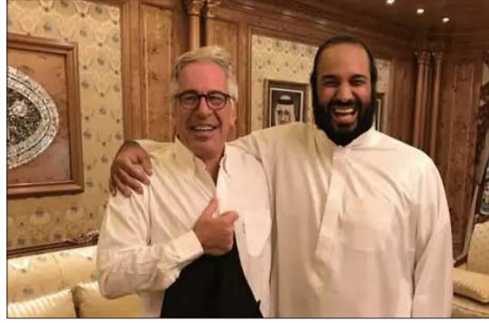
एपस्टीन अपने निजी विमान से पेरिस से रियाद गया था। इस यात्रा के बाद उन्होंने दावा किया कि क्राउन प्रिंस से उन्हें एक भव्य उपहार (एक तंबू और कालीन) दिया था।

वाशिंगटन डीसी, एजेंसी सेक्स अपराधी जेफ्री एपस्टीन सऊदी क्राउन प्रिंस मोहम्मद बिन सलमान का सलाहकार बनना चाहता था। उसने मिडिल ईस्ट (पश्चिम एशिया) में कई साल तक अपने संबंध बनाए। वह एक तरफ बिजनेस के मौके ढूंढ रहा था, और दूसरी तरफ इस्लाम से जुड़ी दुर्लभ और धार्मिक चीजें भी इकट्ठा कर रहा था। उसने इन चीजों को अपने कैरेबियन द्वीप पर बनी एक विवादित इमारत को सजाने में इस्तेमाल किया, जिसे वह 'मस्जिद' कहता था। उसने मक्का की काबा से किस्वा मंगवाई।