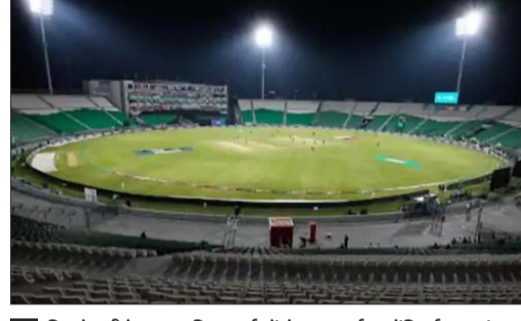
पिछले महीने PSL बिना दर्शकों के शुरू हुई, क्योंकि ईंधन महंगा होने के कारण लोगों को घर पर रहने की सलाह दी गई थी।

पाकिस्तान क्रिकेट बोर्ड (PCB) के चेयरमैन मोहसिन नकवी, जो आंतरिक मामलों के मंत्री भी हैं, ने इस्लामाबाद में प्रधानमंत्री शरीफ से