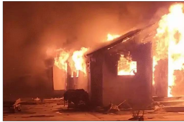
अफगानिस्तान की राजधानी काबुल पर पाकिस्तानी हमले के बाद धमाके का फुटेज। फोटो 17 मार्च की है।

इसलिए वो उसके खिलाफ हमला करता है। TTP का अफगान तालिबान के