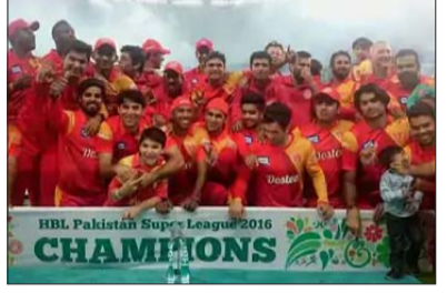
इस्लामाबाद यूनाइटेड ने पहला PSL जीत था।

पाकिस्तान क्रिकेट बोर्ड (PCB) के चेयरमैन मोहसिन नकवी, जो आंतरिक मामलों के मंत्री भी हैं, ने इस्लामाबाद में प्रधानमंत्री