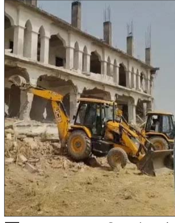
प्रशासन का कहना था कि बुलडोजर और पोकलेन से मशीनों से मद्रसे के स्ट्रक्चर को तोड़ने में काफी परेशानी हो रही है।

मद्रसे के पिलर नहीं टूट पाए। फिर प्रशासन ने