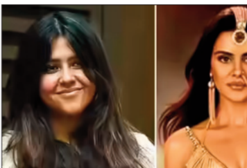
हल के एपिसोड में कहानी एक गहरे लव ट्रायंगल पर आधारित रही है, फिनले से पहले मेकर्स ने कई नए किस्वरों की एंटी भी कराई है, जिससे क्लासिक्स को और ज्यादा हार्ट-वोल्टेज बनाने की तैयारी है।

टीवी इंडस्ट्री की क्वीन कही जाने वाली एकता कपूर ने अपने लोकप्रिय सुपरनेचुरल शो नागिन 7 को लेकर अहम अपडेट साझा किया है। उन्होंने साफ किया है कि मौजूदा सीजन जल्द ही खत्म होने वाला है और अगले साल इसे नए फॉर्मेट में फिर से शुरू किया जाएगा। उन्होंने कहा, 'नागिन को लेकर कुछ अपडेट देने आई हूँ। दोस्तों, मैंने कल एक पोस्ट किया था और मुझे एहसास नहीं था कि हम अचानक शो खत्म करने वाले हैं। एकता ने अपने इंस्टाग्राम स्टोरी पर एक और वीडियो भी साझा किया। इसमें उन्होंने छोटे सीजन बनाने के अपने फैसले के बारे में विस्तार से बताया। उन्होंने कहा, 'नागिन को हर साल प्रसारित करने के लिए हमें छोटे सीजन बनाने चाहिए ताकि मुझे अपना सारा समय न देना पड़े और मैं बाकी कामों पर ध्यान दे सकूँ। अगर सीजन लंबा हो जाता है, तो अगले साल वापसी के लिए हमें एक ब्रेक की जरूरत होगी।' लेकिन दर्शकों की डिमांड को देखते हुए इसे 48 एपिसोड तक बढ़ाया गया।