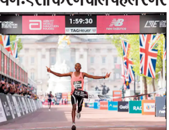
तोड़ा। उन्होंने पिछले साल लंदन में 2:15:50 में मैराथन पूरी कर रिकॉर्ड बनाया था। केन्या की हेलेन ओबिरी और जॉयसिलिन जेपकोसंगेई दूसरे और तीसरे स्थान पर रहीं। इस कामयाबी में तकनीक का भी बड़ा योगदान रहा। सावे और केनेलचा ने एडिडोस के 'Adizero Adios Pro Evo 3' जूते पहनकर दौड़ लगाईं। इनकी कीमत 500 डॉलर (करीब 41,700 रुपये) है और वजन 97 ग्राम है। कंपनी के अनुसार ये 30% हल्के हैं और रनिंग इकोनॉमी 1.6% तक बेहतर करते हैं।

केन्या के सेबेस्टियन सावे 2 घंटे से कम समय में मैराथन पूरा करने वाले पहले खिलाड़ी बन गए हैं। उन्होंने लंदन मैराथन में 1:59:30 का समय लेकर नया वर्ल्ड रिकॉर्ड बनाया। इससे पहले रिकॉर्ड केरिबन किपटम के नाम था। उन्होंने 2023 शिकागो मैराथन में 2:00:35 का समय लिया था। सावे ने इसे 65 सेकेंड से सुधारा। उन्होंने एलियुड किपचोगे के 2019 के अनौपचारिक 1:59:40 रिकॉर्ड को भी पीछे छोड़ दिया है। दूसरे स्थान पर इथियोपिया के योयिफ केनेलचा रहे, जिन्होंने 1:59:41 का समय लिया। वे भी दो घंटे से कम में दौड़ पूरी करने में सफल रहे। युगांडा के जैकब किर्क्लामो ने 2:00:28 के समय के साथ ब्रॉन्ज मेडल जीता। इथियोपिया की टिगास्ट असेफा ने 2:15:41 के समय के साथ महिलाओं में अपना ही वर्ल्ड रिकॉर्ड 1.6% तक बेहतर करते हैं।