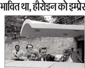
हमला जॉन डब्ल्यू हिकली जूनियर ने किया था। उसने एक फिल्म अभिनेत्री को प्रभावित करने के लिए राष्ट्रपति पर 1.7 सेकेंड में छह गोलियां चला दी थीं। घटना 30 मार्च 1981 की है। रीगन वाशिंगटन डीसी में एक मीटिंग में शामिल होने के बाद अपनी कार की तरफ जा रहे थे। उनके चारों तरफ मीडिया और लोगों की भीड़ थी। अचानक उसी भीड़ से निकलकर एक शख्स ने रीगन पर फायरिंग शुरू कर दी। रीगन पर पांच गोलियां दागी गईं, लेकिन वे हर गोली से बच गए। छठी गोली से भी वे बच ही गए थे, लेकिन वह बुलेटग्रुफ कार के शीशे से टकराकर फिर से रीगन के पास लौटी और उनके सीने में जा धंसी। उस अफरातफरी में रीगन को शुरुआत में पता भी नहीं चला कि उन्हें गोली लगी है। उन्हें तब अहसास हुआ जब खांसते समय उनके मुंह से खून निकलने लगा। वह जमीन पर गिर गए। जॉर्ज वाशिंगटन यूनिवर्सिटी अस्पताल पहुंचते-पहुंचते उनकी हालत इतनी गंभीर हो गई थी कि वे मौत से कुछ ही मिनट दूर थे। हालांकि, डॉक्टरों ने उनके सीने से गोली समय पर निकाल ली, जिससे उनकी जान बच गई। इस घटना में रीगन के 3 सहयोगियों को भी गोली लगी, लेकिन वे भी रीगन की तरह बच गए। गोली चलाने वाले जॉर्ज हिकली को मौके पर ही पकड़ लिया गया।

अमेरिका की राजधानी वाशिंगटन डीसी में शनिवार रात सालाना व्हाइट हाउस कॉरस्पॉन्डेंट्स डिनर के दौरान फायरिंग हो गई। इस कार्यक्रम में राष्ट्रपति डोनाल्ड ट्राम भी मौजूद थे। यह घटना वाशिंगटन हिल्टन होटल में हुई। करीब 60 साल पुराना यह होटल अपने एम (M) आकार के डिजाइन के लिए जाना जाता है। यहां लंबे समय से व्हाइट हाउस कॉरस्पॉन्डेंट्स डिनर होता आ रहा है। इसके अलावा फस्ट लेडी लंच और नेशनल प्रेयर ब्रेकफास्ट जैसे बड़े कार्यक्रम भी यहीं आयोजित होते हैं। इस होटल का इतिहास भी काफी चर्चित रहा है। करीब 45 साल पहले यहीं तत्कालीन राष्ट्रपति रोनाल्ड रीगन पर जानलेवा हमला हुआ था, जिसमें वे गंभीर रूप से घायल हो गए थे। यह