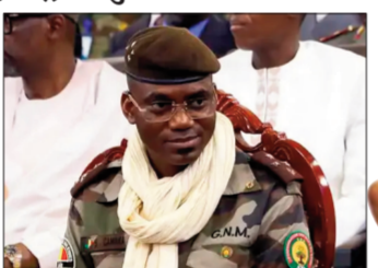
सुरक्षित जगह ले जाया गया क्योंकि उनके घर को भी निशाना बनाया गया था। रक्षा मंत्री सादियो कामारा माली की सैन्य सरकार के सबसे प्रभावशाली नेताओं में से एक थे। वे पेशे से सैन्य अधिकारी थे और लंबे समय तक सेना में सेवा देने के बाद शीर्ष नेतृत्व तक पहुंचे। 2020 और 2021 में हुए सैन्य तख्तापलट के बाद उनका कद तेजी से बढ़ा और वे सत्ता के केंद्र में आ गए। रक्षा मंत्री के रूप में उन्होंने माली की सुरक्षा नीति तय करने में अहम भूमिका निभाई। कामारा को माली और रूस के बीच बढ़ते सैन्य संबंधों का प्रमुख सूत्रधार माना जाता था।

माली के रक्षा मंत्री सादियो कामारा की बम धमाके में मौत हो गई। शनिवार को राजधानी बमाको से करीब 15 किमी दूर काटी शहर में उनके घर पर आत्मघाती कार से हमला किया गया। हमले में सादियो की दूसरी पत्नी और दो पोते भी मारे गए। यह जानकारी उनके परिवार और अधिकारियों ने दी। एक रिश्तेदार ने रॉयटर्स को उनकी मौत की पुष्टि की, जबकि उनके साले ने फेसबुक पोस्ट में इसकी जानकारी दी। हमले के पीछे अल-कायदा से जुड़ा जिहादी संगठन JNIM और तुआंग विद्रोही समूह FLA का गठजोड़ बताया जा रहा है। दोनों संगठनों ने मिलकर यह हमला किया। इस हमले के साथ ही देश के कई हिस्सों में भी हिंसा भड़क गई। बमाको, गाओ, क्वादल और सेवेरे समेत कई शहरों में गोलीबारी और अहम भूमिका निभाई। कामारा को माली और रूस के बीच बढ़ते सैन्य संबंधों का प्रमुख सूत्रधार माना जाता था।