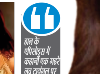
हल के एपिसोड में कहानी एक गहरे लव ट्रायंगल पर आधारित रही है, फिनले से पहले मेकर्स ने कई नए किस्वरों की एंटी भी कराई है, जिससे क्लासिक्स को और ज्यादा हार्ट-वोल्टेज बनाने की तैयारी है।

एकता कपूर ने यह भी स्पष्ट किया कि आगे से शो को हर साल जारी रखने के लिए छोटे सीजन बनाए जाएंगे। उनका मानना है कि लंबे सीजन की वजह से ब्रेक लेना जरूरी हो जाता है, जबकि छोटे सीजन दर्शकों को रुचि बनाए रखते हैं और प्रोडक्शन को भी लचीला बनाते हैं। नागिन 7 का आखिरी एपिसोड 7 जून को प्रसारित होगा, जो कि एकता कपूर का जन्मदिन भी है। इस सीजन में प्रियंका चाहर चौधरी मुख्य भूमिका में नजर आ रही हैं। एकता कपूर ने अपनी इंस्टाग्राम स्टोरी में शो के भविष्य को लेकर चल रही अटकलों पर बात करते हुए स्पष्ट किया कि सीजन को समाप्त करने का फैसला आंशिक रूप से शेड्यूलिंग की वजह से लिया गया है।