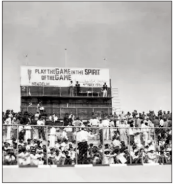
गेम्स का केंद्र भी अहमदाबाद ही रहेगा। गुजरात सरकार ने इसके लिए बड़े स्तर पर स्पॉट्स इन्फ्रास्ट्रक्चर का निर्माण शुरू कर दिया है। सरदार वल्लभभाई पटेल स्पोर्ट्स एन्क्लेव: नरेंद्र मोदी स्टेडियम के पास 355 एकड़ में फैला यह इलाका मुख्य केंद्र होगा। यहां एक्वेटिक्स, टेनिस सेंटर और इंडोर एरना बनाए जा रहे हैं। कराई स्पोर्ट्स

नई दिल्ली, एजेंसी 2036 ओलिंपिक की मजबूत दावेदारी और 2030 कॉमनवेल्थ गेम्स (CWG) की मेजबानी हासिल करने के बाद अब भारत की नजरें 2038 के एशियन गेम्स पर हैं। भारतीय ओलिंपिक संघ (IOA) ने आधिकारिक तौर पर इसके लिए अपनी इच्छा जाहिर की है। गुरुवार को चीन के सान्या में ओलिंपिक काउंसिल ऑफ एशिया (OCA) की एजीक्यूटिव बोर्ड की बैठक हुई। इसमें भारत के प्रस्ताव पर चर्चा की गई। बोर्ड ने फैसला किया है कि भारत की तैयारियों का जायजा लेने के लिए जल्द ही एक इवैल्यूएशन टीम देश का दौरा करेगी। 2038 के स्लॉट के लिए भारत के अलावा साउथ कोरिया और मंगोलिया ने भी अपनी रुचि दिखाई है। 2036 ओलिंपिक और 2030 CWG की तरह 2038 एशियन