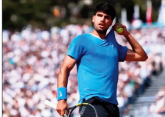
अल्काराज को बार्सिलोना ओपन के पहले दौर में कलाई में चोट लगी थी।

दगी में सिनर और नोवाक जोकोविच के बीच खिताबी जंग और रोचक होगी। अल्काराज को इसी महीने बार्सिलोना ओपन के पहले दौर में कलाई में चोट लगी थी। ओटो विटानन के खिलाफ मैच जीतने के बाद दूर बढ़ने पर उन्होंने टूर्नामेंट छोड़ दिया था। 17 अप्रैल को उन्होंने मॉड्रिच मास्टर्स से भी नाम वापस ले लिया था, तभी से फ्रेंच ओपन खेलने पर सस्पेंस था। शुरूआत के मेडिकल टेस्ट के बाद उन्होंने पेरिस न जाने की पुष्टि कर दी।