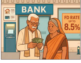
बैंक में यह दरें 7.00% से 7.10% के बीच हैं। रिटर्न के मामले में स्मॉल फाइनेंस बैंक (SFBs) सबसे आगे हैं, जहां 8.5% तक ब्याज मिल रहा है। इंसुरएफ (ESAF) स्मॉल फाइनेंस बैंक 501 दिनों की एफडी पर 8.50% ब्याज दे रहा है। इसके अलावा सूर्योदय, शिवालिंक, इक्विटास और जना स्मॉल फाइनेंस बैंक भी अलग-अलग अवधि के लिए 8.00% से 8.30% तक ब्याज ऑफर कर रहे हैं। हालांकि, बड़े कॉर्पोरेट बैंकों के मुकाबले इनमें जोखिम थोड़ा ज्यादा माना जाता है। एक्सपर्ट्स की मुताबिक, सारा पैसा एक साथ एक ही एफडी में लगाने के बजाय उसे छोटी, मध्यम और लंबी अवधि में बांटकर निवेश करना चाहिए। बेहतर मुनाफे के लिए एफडी के साथ सीनियर सिटीजन सेविंग स्कीम (SCSS) या पीपीएफ (PPF) को भी शामिल किया जा सकता है।

शेयर बाजार में जारी उतार-चढ़ाव के बीच सुरक्षित निवेश चाहने वाले सीनियर सिटीजन के लिए फिक्स्ड डिपॉजिट (FD) एक बार फिर सबसे पसंदीदा विकल्प बनकर उभरा है। साल 2026 में रिटायरमेंट के बाद अपनी पूंजी की सुरक्षा और रेगुलर इनकम को प्राथमिकता देने वाले बुजुर्गों के लिए एफडी पर शानदार रिटर्न मिल रहा है। सीनियर सिटीजन को आमतौर पर आम प्रादकों के मुकाबले 0.50% (50 बेसिस पॉइंट्स) ज्यादा ब्याज मिलता है। ब्याज की दरें आरबीआई की पॉलिसी, निवेश की अवधि और बैंकों की नकदी स्थिति पर निर्भर करती हैं। सरकारी बैंकों में सीनियर सिटीजन के लिए एफडी दरें फिलहाल 7% के आसपास बनी हुई हैं। पंजाब नेशनल बैंक, यूनियन बैंक और केनरा बैंक 444 और 555 दिनों जैसी चुनिंदा अवधि के लिए