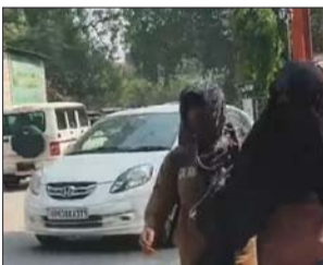
गोरखपुर में सुबह से तेज धूप निकली है। इससे बचने के लिए लोग चेहरे को गमछे से ढककर बाहर निकल रहे हैं।

लखनऊ। वाराणसी/ प्रयागराज/ कानपुर। यूपी में भीषण गर्मी और लू चल रही है। सुबह से तेज धूप निकली है। मौसम विभाग ने शुकुवार को 40 जिलों में लू की चेतावनी जारी की है। सीजन में पहली बार 17 जिलों में वाम नाइट का अलर्ट है। यानी रातें भी गर्मी होंगी।