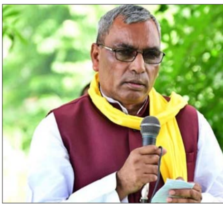
राष्ट्रीय पंचायती राज दिवस पर प्रदेशभर में जनभागीदारी का उत्सव

जनपद स्तर पर आयोजित कार्यक्रमों में ग्राम प्रधानों एवं पंचायत सहायकों को उनके उत्कृष्ट कार्यों के लिए सम्मानित किया गया। इस दौरान पंचायत प्रतिनिधियों एवं कर्मियों के योगदान की सराहना करते हुए उन्हें भविष्य में और अधिक प्रभावी एवं गुणवत्तापूर्ण कार्य करने हेतु प्रेरित किया गया।