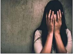
युवती की आपत्तिजनक तस्वीरें मंगवा लीं। बाद में उन्हें वायरल करने की धमकी देकर ब्लैकमेल करने लगा।

लखनऊ। लखनऊ में यूपीएससी की तैयारी कर रही एक युवती से दुष्कर्म किया गया है। आरोप है कि इंस्टाग्राम पर चार साल पहले हुई दोस्ती के माध्यम से युवती की आपत्तिजनक तस्वीरें हासिल कर लीं और उन्हें वायरल करने की धमकी देकर दुष्कर्म किया। 35 हजार रुपए भी ऐंट लिए।