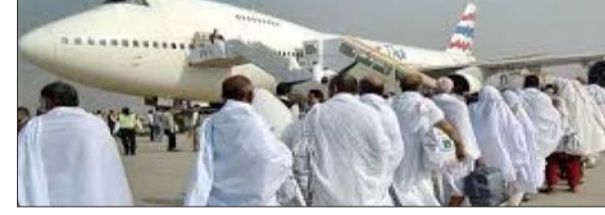
तमसा संकेत, संवाददाता

प्रदेश के विभिन्न जिलों से श्रद्धालुओं की बढ़ती भागीदारी