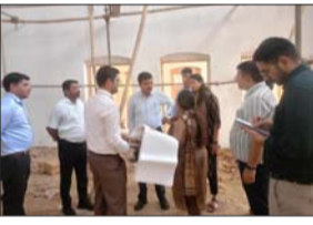
ऐतिहासिक मूल स्वरूप संरक्षित रखते हुए किया जाए स्मृति संग्रहालय निर्माण: डीएम

बाराबंकी। जिलाधिकारी ने अंतर-राष्ट्रीय हॉकी खिलाड़ी पद्मश्री बाबू के.डी. सिंह के पौतक आवास पर विकसित हो रहे स्मृति संग्रहालय निर्माण कार्य का स्थलीय निरीक्षण कर प्रगति का जायजा लिया। निरीक्षण के दौरान जिलाधिकारी ने कहा कि यह परियोजना जनपद की खेल विरासत और ऐतिहासिक धरोहर के संरक्षण से जुड़ी महत्वपूर्ण पहल है। उन्होंने निर्देश दिए कि पौतक आवास की ऐतिहासिकता को अक्षुण्ण रखते हुए यथासंभव मूल स्वरूप को सुरक्षित रखा जाए तथा रिस्टोरेशन कार्य मूल स्वरूप के अनुरूप कराया जाए, जिससे भवन की मौलिक पहचान बनी रहे। जिलाधिकारी ने निर्माण कार्यों को मानकों एवं विशिष्टताओं के अनुरूप गुणवत्तापूर्ण ढंग से समभव्यद्ध पूरा करने के निर्देश देते हुए स्पष्ट किया कि गुणवत्ता से किसी प्रकार का समझौता न किया जाए। उन्होंने कहा कि यह स्मृति संग्रहालय केवल एक