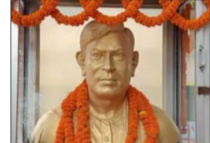
तमसा संकेत, एजेंसी

75 साल पूरे होने पर लखनऊ में तीन दिन साहित्य-संस्कृति का संगम