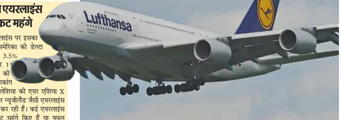
जर्मन एयरलाइंस लुफ्थांसा ने गर्मियों के मौसम के अंत तक घाटे वाले रूट्स बंद करने का फैसला किया है।

दुनिया भर की एयरलाइंस पर इसका असर दिख रहा है। अमेरिका की डेल्टा एयरलाइंस ने करीब 3.5% नेटवर्क में कटौती कर 1 बिलियन डॉलर बचाने की योजना बनाई है। हांगकांग की कैथे पैसिफिक, मलेशिया की एयर एशिया X और न्यूजीलैंड की एयर न्यूजीलैंड जैसी एयरलाइंस भी रूट कम कर रही हैं। कई एयरलाइंस ने टिकट महंगे किए हैं या फ्यूल सरचाज लगाया है।