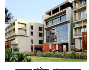
तमसा संकेत, संवाददाता

लखनऊ। लखनऊ के सुरांग गोल्फ सिटी स्थित 'द सेंट्रम हॉटल' में आगामी 24 अप्रैल, 2026 को 'जोनल कान्फ्रेंस-2026' का आयोजन किया जाना है। इस सम्मेलन की अध्यक्षता भारत सरकार के माननीय कृषि एवं किसान कल्याण मंत्री द्वारा की जाएगी। कार्यक्रम का मुख्य उद्देश्य कृषि क्षेत्र से जुड़े विभिन्न विषयों पर चर्चा करना और क्षेत्रीय सहयोग को बढ़ावा देना है। इस जोनल कान्फ्रेंस में उत्तर प्रदेश के साथ-साथ उत्तराखण्ड, हरियाणा, हिमाचल प्रदेश, पंजाब, दिल्ली और जम्मू-कश्मीर के माननीय कृषि मंत्रियों की जानकारी भी साझा की जाएगी।