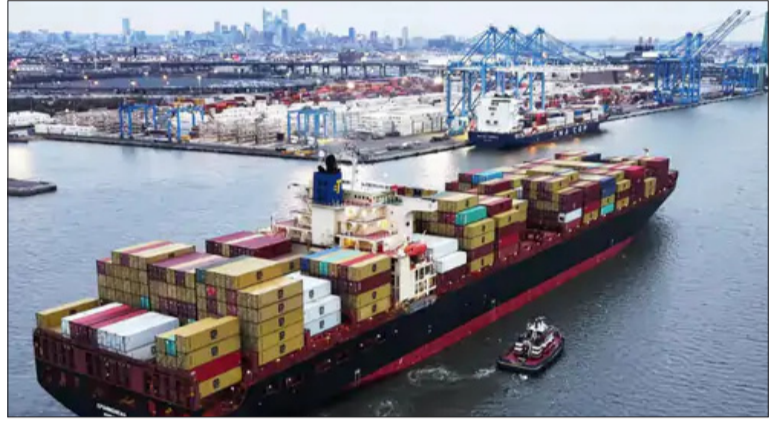
तस्वीर लाइबेरियाई फ्लैग वाले कंटेनर शिप एपामिनोडेस की है, जिसे ईरान की IRGC ने कब्जे में लिया है। (फाइल फोटो)

फ्रांस की कड़ी टिप्पणी: राष्ट्रपति इमैनुएल मैक्रों ने होर्मुज़ स्ट्रेट को नाकाबंदी को अमेरिका की गलती बताया है। उन्होंने कहा कि इस फैसले के बाद ईरानी अधिकारियों ने अपना शुरुआती रुख बदल लिया।