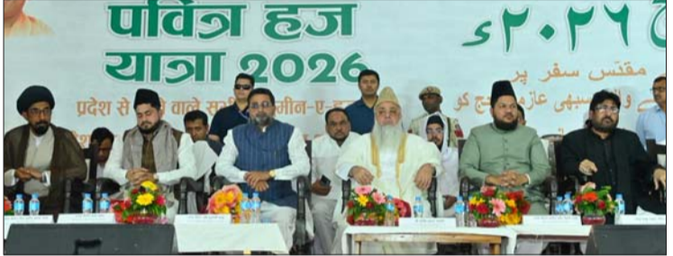
की तरफ से एवं माननीय कैबिनेट मंत्री श्री ओम प्रकाश राजभर जी की तरफ से सभी हज-2026 पर जाने हजरतों को उनकी मंगल यात्रा की हार्दिक शुभकामनाएं देता हूँ। हमारे प्रधानमंत्री श्री नरेंद्र मोदी जी, केंद्रीय मंत्री किरण रिजिजू जी एवं हमने खुद हज यात्री जो पूरी ये प्रक्रिया है, हज का जो पूरा सफर है, ये पूरे सुकून और इत्मीनान से आपको मिले, इसके लिए हमने पूरी इमानदारी से काम किया है। प्रधानमंत्री श्री नरेंद्र मोदी जी