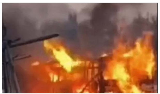
यह तस्वीर मेटर की है। यहां चलती सीएनजी बस में अचानक आग लग गई।

तमसा संकेत, एजेंसी लखनऊ/ वाराणसी/ प्रयागराज/ कानपुर। यूपी में भीषण गर्मी पड़ रही है। आज यानी बुधवार को 30 जिलों में हॉट वेव (लू) का अलर्ट है। सुबह से तेज धूप निकली है। आगरा और अयोध्या में इतनी भीषण गर्मी है कि प्रशासन सड़कों पर पानी की बौछारें डाल रहा है। वहीं गोरखपुर जू में गर्मी से बचाने के लिए भालूओं को 8-8 किलोग्राम की फ्रूट आइसक्रीम खिलाई जा रही है। मौसम विभाग (IMD) का कहना है कि आज से 4 दिन यानी 25 अप्रैल तक गर्मी से राहत मिलने की उम्मीद नहीं है। पारा 45C के पार पहुंच सकता है।