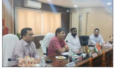
उन्होंने अधिकारियों को निर्देशित किया कि प्रत्येक प्रकरण में संवेदनशीलता एवं जवाबदेही के साथ कार्य करें, जिससे आमजन को समय पर न्याय मिल सके। तहसील रामनगर स्थित लोधेश्वर धाम में निर्माणधीन कॉरिडोर एवं एससीआर से संबंधित कार्यों के संबंध में जिलाधिकारी ने कहा कि इन परियोजनाओं को प्राथमिकता के आधार पर आगे बढ़ाया जाएगा। उन्होंने संबंधित विभागों को गुणवत्ता के साथ निर्धारित समयसीमा में कार्य पूर्ण

कराने के निर्देश दिए, जिससे धार्मिक पर्यटन को बढ़ावा मिले और जनपद के विकास को गति मिल सके। जिलाधिकारी ने पत्रकारों से नियमित संवाद बनाए रखने की प्रतिबद्धता व्यक्त करते हुए कहा कि प्रत्येक एक-दो माह में संवाद स्थापित कर जनपद की समस्याओं, विकास कार्यों एवं समाधान की प्रगति की समीक्षा की जाएगी। उन्होंने कहा कि प्रशासन और मीडिया के बीच सकारात्मक समन्वय जनहित में महत्वपूर्ण भूमिका निभाता है।