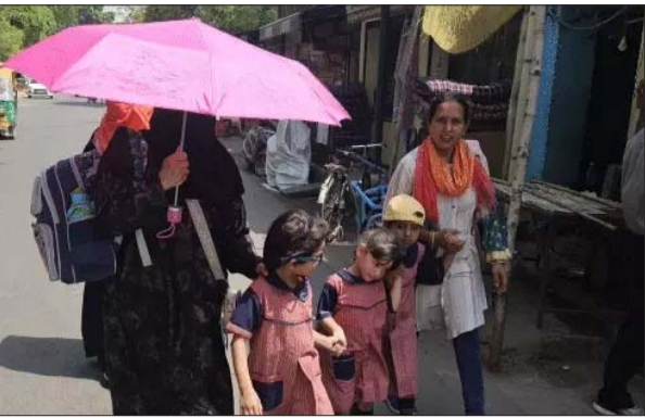
ये तस्वीरें लखनऊ की हैं। यहां मंगलवार दोपहर में पारा 40 डिग्री पार कर गया। धूप की तपिश से बचने के लिए लोगों को छाता लगाना पड़ा।

प्रयागराज में वाहनों चालकों को गर्मी से राहत देने लिए नगर निगम ग्रीन शेड लगा रही है। इसके शुरुआत सिविल लाइंस के महाराणा प्रताप चौहाने से की है। इसके लगने से टूटलर वालों के साथ स्कूली बच्चों को भी राहत मिलेगी।