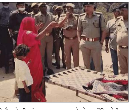
तक जाग रहे थे, क्योंकि बेटी का जन्मदिन था। लगभग 11 बजे खाना खाया था। इसके बाद मेरे पति ने मुझे घर के अंदर सोने के लिए भेज दिया और खुद बाहर खाट पर सो गए। वह पहले भी ठंड के दिनों से बाहर ही सोते थे। रात में क्या हुआ, इसकी मुझे कोई जानकारी नहीं है। सुबह करीब