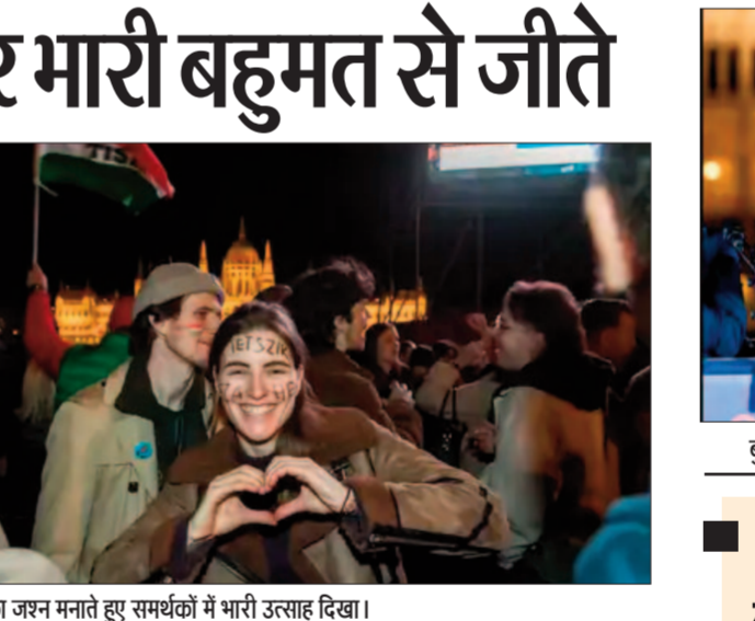
मग्यार की जीत का जश्न मनाते हुए समर्थकों में भारी उत्साह दिखा।

रूस पर लगे प्रतिबंधों का कई बार विरोध किया और यूक्रेन युद्ध जल्दी खत्म करने की बात कही। उनके आलोचकों का कहना है कि यह रूस को खुश करने के लिए है।