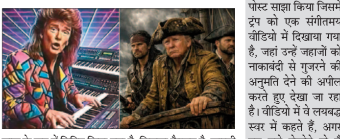
डाकू के रूप में चित्रित किया गया है, जिसका कैप्शन है, फारसी खाड़ी और होर्मुज स्ट्रेट के दयनीय समुद्री डाकू। जिसके जरिए ईरान ट्रंप को फारस की खाड़ी का दयनीय समुद्री डाकू कह रहा है। इसी बीच, मुंबई स्थित ईरान के वाणिज्य दूतावास ने भी ईरान की नैसैनिक क्षमताओं को उजागर करते हुए अपनी नैसैनिक ताकत को एक वीडियो के माध्यम से शेयर किया है। वीडियो के कैप्शन में लिखा है, फारस की खाड़ी की लाल मधुमक्खियां, हां, तेज मिसाइल नौकाएं तैयार हो रही हैं। यह मजेदार है कि ट्रंप ईरान की नैसैनिकों को 'खलत' बताते रहे... अब उन्हें पता चलने वाला है कि मिसाइलों का झुंड कितनी जल्दी आपके घर सकता है। अभी तो सिर्फ ट्रेनर है, पिक्चर अभी बाकी है।

नई दिल्ली, एजेंसी मिडिल ईस्ट में जारी तनाव और अमेरिका-ईरान के बीच बेतुतीया रही हालिया शांति वार्ता के बीच ईरान ने एक नई तरह की कूटनीतिक जंग छेड़ दी है। ईरान के कई अंतरराष्ट्रीय राजनयिक हैंडलस अमेरिकी राष्ट्रपति डोनाल्ड ट्रंप को निशाना बनाते हुए सोशल मीडिया पर मीम शेयर कर रहे हैं। दरअसल, दक्षिण अफ्रीका से लेकर मुंबई तक के ईरानी दूतावासों ने व्यंग्यात्मक वीडियो और तीखे संदेशों के जरिए ट्रंप का मजाक उड़ा रहा है और अपनी नैसैनिक शक्ति का प्रदर्शन कर रहे हैं। ईरानी दूतावासों के द्वारा इन पोस्ट्स के जरिए ट्रंप को समुद्री डाकू बताने से लेकर मिसाइलों के झूठ की चेतावनी तक दी है। ईरानी दूतावास द्वारा जारी एक अन्य पोस्ट में, ट्रंप को समुद्री