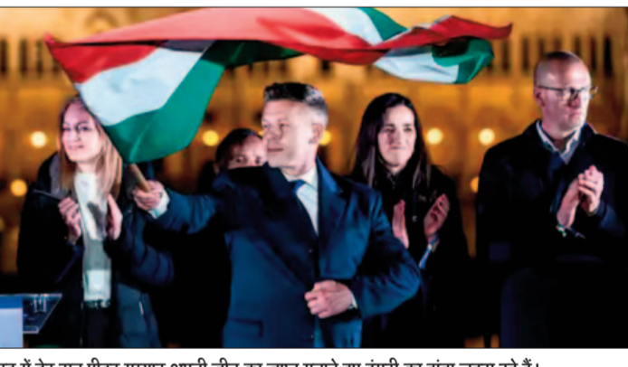
बुडापेस्ट में देर रात पीटर मग्यार अपनी जीत का जश्न मनाते हुए हंगरी का झंडा लहरा रहे हैं।

ऑर्बन ने अपनी हार स्वीकार कर ली है और अपने समर्थकों को धन्यवाद दिया। उन्होंने कहा कि अब वे विपक्ष से देश की सेवा करेंगे। ऑर्बन को अमेरिकी राष्ट्रपति डोनाल्ड ट्रम्प का करीबी सहयोगी माना जाता रहा है। हाल ही में उपराष्ट्रपति जे.डी. वेंस ने