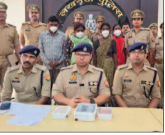
सरगना महिला, पति और 2 रिश्तेदार लखनऊ में गिरफ्तार, नागपुर से आते थे

तमसा संकेत, एजेंसी मोहनलालगंज। लखनऊ पुलिस ने बेहद शांति अंदाज में टप्पेबाजी कर रहे अंतरराज्यीय गैंग का पर्दाफाश किया है। यह गैंग ई-रिक्शा में सवार होकर उल्टी का वहां और सेप्टी पिन् चुभाकर यात्रियों का ध्यान भटकता था। कुछ ही सैकंड में उनके जेवर-नगदी पार कर देता था। गिरोह ने 6 माह में लखनऊ में 3 घटनाओं को अंजाम दिया था। पुलिस ने गिरोह को पकड़ने के लिए 700 से ज्यादा सीसीटीवी कैमरे खंगाले। उसके बाद महिला दरोगा को सादे कपड़ों में तैनात किया। मंगलवार को पुलिस ने गिरोह की सरगना महिला को उसके पति और 2 महिला रिश्तेदारों के साथ गिरफ्तार किया।