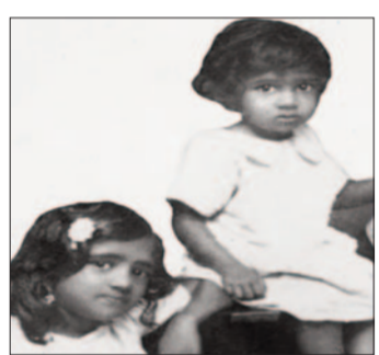
नई दिल्ली। सिंगर लता मंगेशकर और आशा भोसले की याद में पुणे में एशिया का सबसे बड़ा अस्पताल बनाया जाएगा। दोनों सिंगर्स के भाई और म्यूजिक डायरेक्टर हृदयनाथ मंगेशकर ने सोमवार को यह जानकारी दी। हृदयनाथ मंगेशकर ने मीडिया से बातचीत में कहा कि पुणे में उनकी मां और लता मंगेशकर ने गरीबों की सेवा के लिए अस्पताल बनाने का सपना