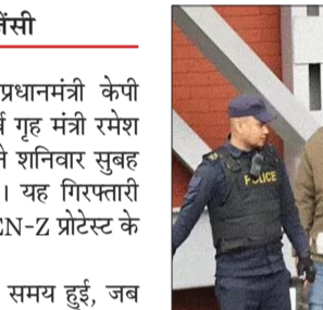
नेपाल के पूर्व प्रधानमंत्री केपी शर्मा ओली को आज सुबह भक्तपुर के गुंड स्थित उनके घर से गिरफ्तार किया गया।

काठमांडू, एजेंसी नेपाल के पूर्व प्रधानमंत्री केपी शर्मा ओली और पूर्व गृह मंत्री रमेश लेखक को पुलिस ने शनिवार सुबह गिरफ्तार कर लिया। यह गिरफ्तारी पिछले साल हुए GEN-2 प्रोटेस्ट के मामले में हुई है। यह कार्रवाई उस समय हुई, जब कल ही बालेन शाह ने नए प्रधानमंत्री के तौर पर शपथ ली है। पुलिस के अनुसार, ओली को शनिवार सुबह भक्तपुर के गुंड स्थित उनके घर से पकड़ा गया। वहीं, रमेश लेखक को सुबह करीब 5 बजे सूर्यविनायक से गिरफ्तार किया गया। यह कार्रवाई गृह मंत्रालय की शिकायत के बाद शुरू हुई जांच के आधार पर की गई है।