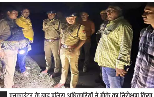
एनकाउंटर के बाद पुलिस अधिकारियों ने मौके का निरीक्षण किया।