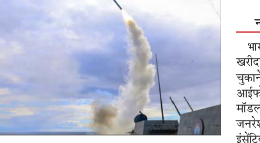
ईरान मिडिल ईस्ट में मौजूद वॉरशिप से ईरान के खिलाफ टॉमहॉक मिसाइलों का इस्तेमाल कर रहा है।

अमेरिका के पास करीब 4000 टॉमहॉक मिसाइलें टॉमहॉक अमेरिका की खास क्रूज मिसाइल है। यह 1,000 मील (1609 किमी) तक उड़कर 1,000 पाउंड (453 किलो) विस्फोटक सटीक निशाने पर गिरा सकती है। इसके एडवांस वर्जन की रेंज 2500 किमी है। टॉमहॉक का बड़े पैमाने पर पहला इस्तेमाल 1991 के खाड़ी युद्ध में हुआ। अमेरिका ने इराक पर दूर से सैकड़ों मिसाइलें दागीं। इसे रिमोट वार कहा गया, क्योंकि पहली बार इतनी सटीक और लंबी दूरी की क्रूज मिसाइलें इस्तेमाल हुईं। टॉमहॉक को समुद्र में मौजूद युद्धपोतों और पनडुब्बियों से भी दागा जा सकता है, जिससे दुश्मन के इलाके में घुसे बिना हमला संभव हो जाता है। अमेरिका बीते एक महीने से ईरान पर हमले कर रहा है। यह पूरी तरह 'स्टैंड-ऑफ स्ट्राइक' है। यानी हमला इतनी दूर से किया गया कि अमेरिकी सैनिकों को जमीन पर उतरने की जरूरत नहीं पड़ रही है।