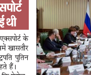
रूस के उप प्रधानमंत्री अलेक्जेंडर नोवाक ने शुक्रवार को देश में पेट्रोल और दूसरे तेल उत्पादों की उपलब्धता और कीमतों की स्थिति की समीक्षा की।

मॉस्को में शुक्रवार को पेट्रोल एक्सपोर्ट के बैन को लेकर बैठक हुई थी। इसमें खासतौर पर यह जोर दिया गया कि राष्ट्रपति पुतिन ईंधन कीमतें नियंत्रित रखना चाहते हैं। मंत्री नोवाक ने बैठक में कहा कि पेट्रोल-डीजल का पर्याप्त स्टॉक है और रिफाइनरियां पूरी क्षमता से काम कर रही हैं। तेल कंपनियों ने कहा कि पेट्रोल-डीजल का पर्याप्त स्टॉक है और रिफाइनरियां पूरी क्षमता से काम कर रही हैं। एक्सपर्ट्स का मानना है कि भारत सीधेतौर पर रोक लगा सकता है। उन्होंने यह भी बताया कि रूस का यूरेलस तेल और दूसरे तेल उत्पाद इन दिनों ब्रेट क्रूड के बराबर या उससे भी महंगे दाम पर बिक रहे हैं।