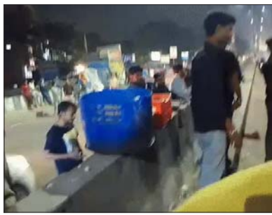
कानपुर में शुक्रवार शाम टैंकर से तेल लूटने के लिए भीड़ लग गई। लोग ड्रम और बाल्टी में पेट्रोल भरने लगे।

है। अफवाहों पर ध्यान न दें। जरूरत के हिसाब से ही ईंधन खरीदें। हमेशा की तरह सात दिन का बैकअप स्टॉक मौजूद है। कौशांबी जिले में NH-2 हाईवे पर शनिवार सुबह डीजल टैंकर और डीसीएम की टक्कर हो गई। हादसा कोखराज थाना क्षेत्र के कल्याणपुर के पास हुआ। टक्कर के बाद टैंकर से बड़ी मात्रा में डीजल सड़क पर फैल गया। डीजल बहता देख आसपास