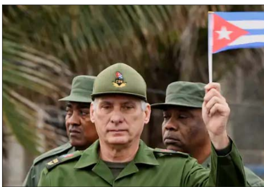
क्यूबा के राष्ट्रपति मिगुएल डियाज कानेल इस महीने में पहले भी कह चुके हैं कि क्यूबा ने अमेरिकी सरकार के साथ बातचीत की है।

हालांकि इतनी सख्त बातें कहने के बावजूद, अमेरिकी अधिकारियों का कहना है कि बातचीत के रास्ते अभी भी खुले हैं और क्यूबा के नेताओं से बातचीत जारी है। क्यूबा के राष्ट्रपति मिगुएल डियाज-कैनल ने भी माना है कि अमेरिका से बातचीत हो रही है। उन्होंने संकेत दिया कि टकराव से बचने के लिए क्यूबा बातचीत करना चाहता है, जबकि अमेरिका का दबाव बढ़ता जा रहा है। कुल मिलाकर, ट्रंप का क्यूबा पर फोकस दिखाता है कि उनकी विदेश नीति अब ज्यादा आक्रामक और सीधे संदेश देने वाली हो गई है।