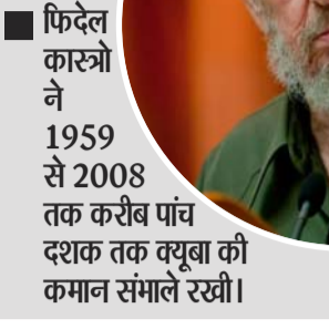
फिदेल कास्त्रो ने 1959 से 2008 तक करीब पांच दशक तक क्यूबा की कमान संभाले रखी।

ट्रम्प के बयान से यह भी साफ होता है कि वह क्यूबा को सिर्फ राजनीतिक नहीं, बल्कि कारोबारी नजरिए से भी देख रहे हैं। वह पहले से ही इस द्वीप में निवेश की संभावना देखते रहे हैं। 1998 में उनकी कंपनी ने चुपचाप क्यूबा का दौरा कराया था। 2011-12 में भी उनके संगठन के लोग वहाँ गольफ कोर्स बनाने की संभावनाएं देख चुके हैं। 2016 के चुनाव प्रचार के दौरान भी ट्रम्प ने कहा था कि क्यूबा निवेश के लिए अच्छा मौका हो सकता है। अब उन्होंने फिर कहा, "वे हमसे बात कर रहे हैं। यह एक असफल देश है। उनके पास न पैसा है, न तेल, कुछ भी नहीं है।"