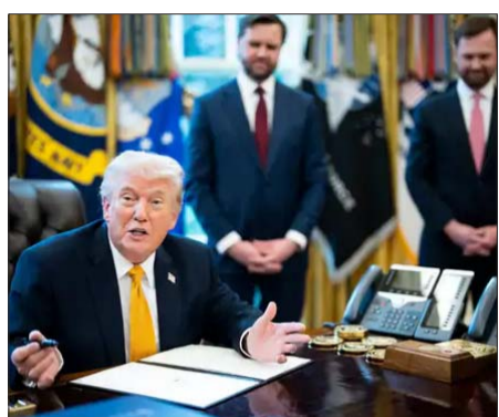
15 मार्च को प्रचारों से क्यूबा के बारे में बात करते हुए ट्रम्प

अमेरिकी राष्ट्रपति ट्रम्प ने एक बड़ा बयान देते हुए कहा है कि अब आगला नंबर क्यूबा का है। यह बात उन्होंने शुक्रवार को मियामी में एक बिजनेस समिट के दौरान कही। ट्रम्प ने हालांकि साफ तौर पर यह नहीं बताया कि क्यूबा के खिलाफ उनका आगला कदम क्या होगा, लेकिन उन्होंने इशारा दिया कि जरूरत पड़ी तो सैन्य ताकत का इस्तेमाल भी किया जा सकता है। ट्रम्प ने कहा-मैंने अमेरिकी सेना को बहुत मजबूत बनाया है। मैंने कभी नहीं सोचा था कि इसका इस्तेमाल करना पड़ेगा, लेकिन कभी-कभी ऐसा करना पड़ता है। वैसे क्यूबा का अगला नंबर है।