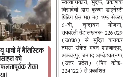
अबू धाबी में बैलिस्टिक मिसाइल को सफलतापूर्वक रोका गया।

शनिवार को यूएई में अबू धाबी के खलीफा इकोनॉमिक जोन (KEZAD) के पास एक बैलिस्टिक मिसाइल को रोके जाने के बाद गिरे मलबे से पांच भारतीय नागरिक घायल हो गए। अबू धाबी मीडिया ऑफिस के अनुसार, यह घटना KEZAD के आस-पास तब हुई जब हवाई सुरक्षा प्रणालियों ने आने वाली मिसाइल को सफलतापूर्वक रोक लिया, जिसके कारण उस इलाके में मलबा गिर गया। अधिकारियों ने पुष्टि की कि इस घटना के बाद पांच लोग घायल हुए, जिन्हें मामूली चोटें आई हैं। बयान में कहा गया, रखलीफा इकोनॉमिक जोन अबू धाबी (KEZAD) के आस-पास पहले बताई गई घटना के संबंध में चल रही जांच के तहत, हो हवाई सुरक्षा प्रणालियों द्वारा एक बैलिस्टिक मिसाइल को सफलतापूर्वक रोके जाने के बाद गिरे मलबे के कारण हुई थी। अधिकारी पुष्टि करते हैं कि