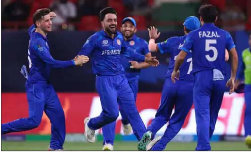
अफगानिस्तान की टीम भारत को एक भी इंटरनेशनल क्रिकेट मैच नहीं हरा सकी है।

अफगानिस्तान टीम 6 से 20 जून के बीच भारत में 1 टेस्ट और 3 वनडे खेलेगी। IPL का 19वां सीजन खत्म होने के बाद सीरीज शुरू होगी। भारतीय क्रिकेट कंट्रोल बोर्ड (BCCI) ने शेड्यूल रिलीज करते हुए बताया कि मुल्लापुर में टेस्ट मैच से सीरीज शुरू होगी। फिर धर्मशाला, लखनऊ और चेन्नई में 3 वनडे खेले जाएंगे। BCCI ने मीडिया रिलीज में बताया कि महाराजा यादवेंद्र सिंह इंटरनेशनल क्रिकेट स्टेडियम में 6 से 10 जून तक टेस्ट मैच होगा। फिर 14 जून को HPCA स्टेडियम में पहला वनडे, 17 जून को इकाना स्टेडियम में दूसरा वनडे और 20 जून को चेन्नई स्टेडियम में तीसरा वनडे खेला जाएगा। सभी वनडे दोपहर 1.30 बजे से शुरू होंगे। अफगानिस्तान ने अपने टेस्ट करियर की शुरुआत ही टीम इंडिया के खिलाफ मैच से की थी।