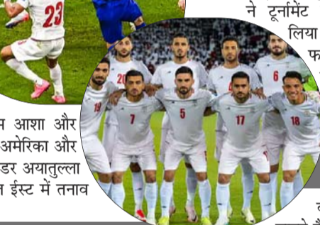
क्रिकेट वर्ल्ड कप में बांग्लादेश बायकांट कर चुका खेल जगत में यह पहला मौका नहीं है जब कोई देश वर्ल्ड कप बायकांट करने के बारे में सोच रहा हो। पिछले महीने ही बांग्लादेश क्रिकेट टीम ने सुरक्षा कारणों को हवाला देते हुए भारत में टी-20 वर्ल्ड कप खेलने से मना कर दिया था। जिसके बाद इंटरनेशनल क्रिकेट कार्टिसिल (ICC) ने बांग्लादेश की जगह स्कॉटलैंड को टूर्नामेंट में एंट्री दे दी।