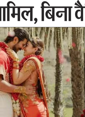
बता दें कि विजय देवरकोंडा और रश्मिका मंदाना 26 फरवरी को राजस्थान के उदयपुर में शादी के बंधन में बंध गए। दोनों की शादी एक प्राइवेट सेरेमनी में आईटीसी ममेंटोस रिसॉर्ट में हुई। सुबह तेलुगु रीति-रिवाजों से विवाह हुआ, जबकि शाम को रश्मिका की कोडवा परंपरा के अनुसार रस्में निभाई गईं।

मुंबई। विजय देवरकोंडा और रश्मिका मंदाना ने हाल ही में परिवार और करीबी लोगों के बीच शादी की। अब यह कपल 4 मार्च को हैदराबाद में ग्रैंड रिसेप्शन देने जा रहा है। रविवार को जारी एक ऑफिशियल अनाउंसमेंट लेटर में विजय और रश्मिका ने बताया कि वेडिंग रिसेप्शन सिर्फ इन्वितेशन वाला इवेंट रहेगा। इस सेलिब्रेशन को सोच-समझकर एक खास गैटरिंग के तौर पर क्यूरेट किया गया है, जिसमें तेलुगु, हिंदी, तमिल, मलयालम और कन्नड़ फिल्म इंडस्ट्री के सदस्यों के साथ-साथ पॉलिटिकल और एडमिनिस्ट्रेटिव सर्कल के कुछ खास मेहमानों का स्वागत किया जाएगा।