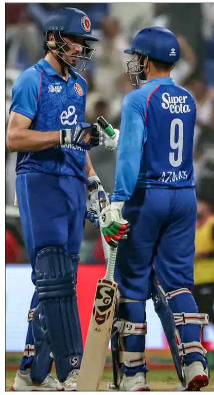
अफगानिस्तान ने भारत को खिलाफ 4 वनडे खेले, 3 में टीम को हार मिली। वहीं एक मुकाबला टाई रहा।

अफगानिस्तान और भारत के बीच 4 वनडे खेले गए। सभी मल्टिनेशन टूर्नामेंट में ही रहे। एशिया कप में दोनों ने 2 मैच खेले, 1 में भारत को जीत मिली, जबकि 2018 में एक मुकाबला टाई भी रहा। 2019 और 2023 के वनडे वर्ल्ड कप में भी दोनों के बीच 2 मैच हुए। सभी में भारत जीता। दोनों टीमों के बीच पहली बार वनडे फॉर्मेट की सीरीज होने जा रही है। टी-20 इंटरनेशनल में दोनों टीमों के बीच 9 मुकाबले हुए। 8 में भारत को जीत मिली, जबकि एशियन गेम्स में एक मुकाबला बेनतीजा भी रहा। दोनों टीमों ने इस फॉर्मेट की इकलौती सीरीज 2024 में खेली थी, तब भारत 3-0 से जीता था।