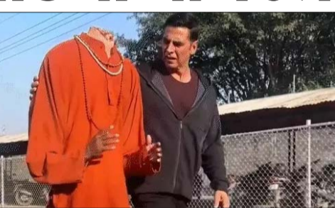
फिल्म का पहला गाना 'राम जी आके मला करेंगे' पहले ही रिलीज हो चुका है और इसे दर्शकों का शानदार रिस्पॉन्स मिला है। यह गाना 55 मिलियन से अधिक व्यूज हासिल कर चुका है और सोशल मीडिया पर तेजी से ट्रेंड कर रहा है। गाने की लोकप्रियता से फिल्म को रिलीज से पहले ही मजबूत चर्चा मिल रही है।

मुंबई। बॉलीवुड अभिनेता अक्षय कुमार की अपकमिंग होरर-कॉमेडी फिल्म भूत बंगला का एक अनोखा प्रोमो सोशल मीडिया पर तेजी से वायरल हो रहा है। इस वीडियो में अक्षय कुमार एक बिना सिर वाले भूत के साथ टहलते नजर आ रहे हैं और बेहद गंभीर अंदाज में उससे भूतों के अस्तित्व पर सवाल करते दिखाई देते हैं। प्रोमो का यह मजेदार कॉन्सेप्ट दर्शकों को खूब पसंद आ रहा है और फिल्म को लेकर उत्सुकता बढ़ गई है। वायरल क्लिप में अक्षय कुमार एक सरकटे प्रेत के साथ बातचीत करते हुए उससे पूछते हैं—“क्या भूत सच में होते हैं?” इस सवाल पर भूत का जवाब डरावना नहीं, बल्कि बेहद मजेदार होता है।