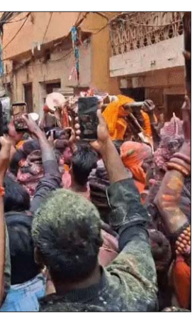
शव यात्रा के बीच भी घाट पर भस्म की होली खेली जा रही है।

मणिकर्णिका घाट पर खेले जाने वाली मसाने की होली का विशेष धार्मिक महत्व है। मान्यता है कि भगवान शिव स्वयं इस दिन यहां विराजमान रहते हैं और अपने गणों के साथ होली खेलते हैं। यह परंपरा इस बात का प्रतीक है कि जीवन और मृत्यु एक ही सत्य के दो पहलू हैं, और अंततः सब कुछ शिव में ही विलीन हो जाता है। काशी की यह अनोखी मसाने की होली न केवल आस्था का प्रतीक है, बल्कि यह जीवन के गूढ़ दर्शन और मोक्ष की अवधारणा को भी जीवंत रूप में प्रस्तुत करती है। सत्य के दो पहलू हैं, और अंततः सब कुछ शिव में ही विलीन हो जाता है। काशी की यह अनोखी