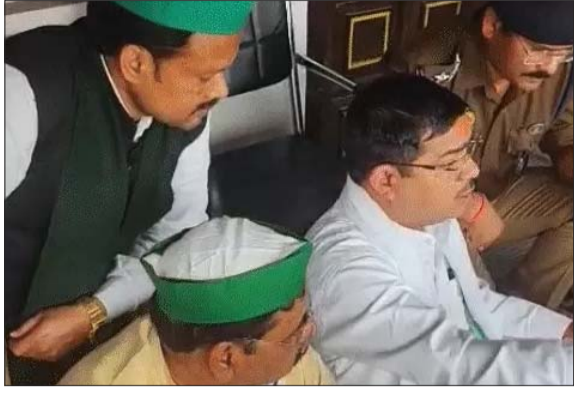
लखनऊ नगर निगम में धरना देते किसान यूनियन के कार्यकर्ता।

तमसा संकेत, एजेंसी लखनऊ। लखनऊ नगर निगम में शनिवार को भारतीय किसान यूनियन ने जोरदार प्रदर्शन किया। सरोजनी नगर के अटल बिहारी वॉर्ड में होलिका दहन की जमीन निजी बिल्डर द्वारा कब्जाने का आरोप लगाया। इस दौरान मेयर