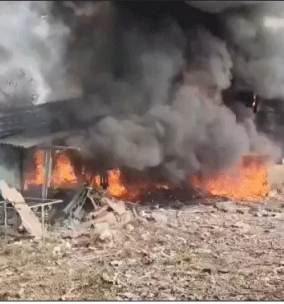
आंध्र प्रदेश के काकीनाडा जिले में स्थित पटाखा फैक्ट्री में शनिवार दोपहर 2 बजे ब्लास्ट हुआ।

अमरावती। आंध्र प्रदेश के काकीनाडा जिले के वेत्तापलेम गांव में शनिवार को पटाखा बनाने वाली यूनित में धमाका हो गया। हादसे में 21 लोगों की मौत हो गई, जबकि 8 लोग गंभीर रूप से घायल हैं। स्थानीय लोगों ने बताया कि दोपहर करीब 2 बजे ब्लास्ट हुआ। धमाके इतना भीषण था कि इसकी आवाज 5 किलोमीटर दूर तक सुनाई दी। इसके बाद ग्रामीण घटनास्थल पर पहुंचे और हादसे में घायल लोगों को अस्पताल भेजना शुरू किया। पुलिस अधिकारी ने बताया- धमाका इतना तेज था कि लार्शों पास के धान के खेतों में जाकर गिरीं। हरे-भरे धान के खेतों के बीच