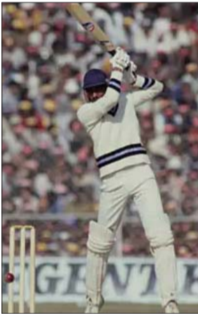
जाएंगे। एडलजी ने 1978 और 1993 के विमेंस वनडे वर्ल्ड कप में भारत की कप्तानी की थी। रवि शास्त्री का मुंबई क्रिकेट से बहुत पुराना और गहरा रिश्ता रहा।

भारतीय क्रिकेट के दिग्गज खिलाड़ी और पूर्व हेड कोच रवि शास्त्री के नाम पर मुंबई के वानखेड़े स्टेडियम में स्टेड बनेगा। मुंबई क्रिकेट एसोसिएशन (MCA) ने फैसला किया है कि ऐतिहासिक वानखेड़े स्टेडियम में अब एक स्टेड का नाम रवि शास्त्री के नाम पर होगा। यह सम्मान किसी भी क्रिकेटर के लिए बहुत बड़ी बात होती है, और अब शास्त्री भी सुनील गावस्कर और सचिन तेंदुलकर जैसे महान खिलाड़ियों की खास लिस्ट में शामिल हो जाएंगे। स्टेडियम में भारत के पूर्व क्रिकेटर दिलिप सरदेसाई, एकनाथ सोलकर और डायना एडलजी के नाम 3 दरवाजों के नाम भी रखे