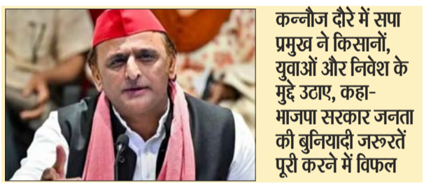
कन्नौज दौरे में सपा प्रमुख ने किसानों, युवाओं और निवेश के मुद्दे उठाए, कहा- भाजपा सरकार जनता की बुनियादी जरूरतें पूरी करने में विफल

कन्नौज। समाजवादी पार्टी के राष्ट्रीय अध्यक्ष एवं पूर्व मुख्यमंत्री अखिलेश यादव ने भाजपा सरकार पर गंभीर आरोप लगाते हुए कहा कि प्रदेश में जनता को बुनियादी सुविधाएं नहीं मिल पा रही हैं। उन्होंने कहा कि बिजली, दवा और इलाज महंगे होते जा रहे हैं, जबकि कैसर और हृदय रोगियों के लिए पर्याप्त इलाज की सुविधाएं उपलब्ध नहीं हैं। इसके लिए उन्होंने भाजपा सरकार को जिम्मेदार ठहराया। शनिवार को कन्नौज के एक दिवसीय दौरे के दौरान मीडिया से बातचीत में उन्होंने कहा कि समाजवादी सरकार के समय लगाया गया काऊ मिलक प्लांट भाजपा सरकार ने बंद कर दिया, जिससे किसानों और दुग्ध उत्पादन को नुकसान हुआ। उन्होंने कहा कि आलू किसानों को उनकी फसल का उचित मूल्य नहीं मिल रहा है और वे