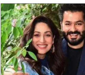
जब यामी गौतम से फिल्म की रिलीज और इससे जुड़े अन्य पहलुओं पर सवाल किया गया, तो उन्होंने कहा कि फिल्म से संबंधित आधिकारिक जानकारी निर्देशक आदित्य धर ही साझा करेंगे। हालांकि उन्होंने यह जरूर सकेत दिया कि 19 मार्च को उनका सिनेमा हॉल में एक 'जरूरी अपॉइंटमेंट' है।

मुंबई। अभिनेता रणवीर सिंह की बहुप्रतीक्षित फिल्म 'धुरंधर 2' को लेकर दर्शकों में जबदस्त उत्साह देखने को मिल रहा है। पहले पार्ट की सफलता के बाद से ही फिल्म के दूसरे भाग का बेसब्री से इंतजार किया जा रहा था, और अब 19 मार्च को इसकी रिलीज की आधिकारिक पुष्टि के साथ ही फैस की उत्सुकता और बढ़ गई है। इस बीच फिल्म के निर्देशक आदित्य धर की पत्नी और अभिनेत्री यामी गौतम ने फिल्म को लेकर बड़ा बयान देकर चर्चा को और तेज कर दिया है। एक मीडिया बातचीत के दौरान यामी गौतम ने खुलासा किया कि वह 'धुरंधर 2' देख चुकी हैं और फिल्म ने उन्हें गहराई से प्रभावित किया। उन्होंने कहा कि यह फिल्म उनकी अपेक्षाओं से कहीं बढ़कर है और इसे देखकर वह भावुक हो गई थीं। यामी के अनुसार, फिल्म का अनुभव इतना प्रभावशाली था।