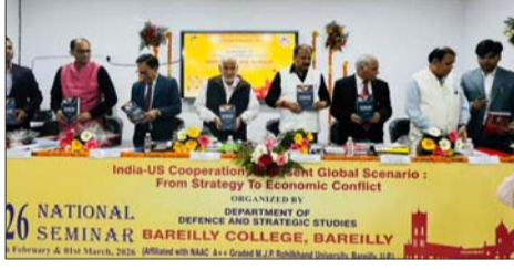
उद्घाटन सत्र में एनसीसी कैडेट्स द्वारा अतिथियों को मंच तक परेक्ट किया गया तथा मुख्य अतिथि द्वारा दीप प्रज्वलन कर कार्यक्रम का विधिवत उद्घाटन किया गया।