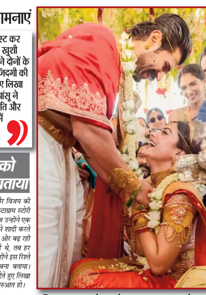
कल्याणी ने शादी को दोस्ती पर आधारित बताया।

एक्ट्रेस कल्याणी प्रियदर्शन ने रश्मिका और विजय की शादी पर खास पोस्ट शेयर किया। उन्होंने इंस्टाग्राम स्टोरी पर शादी की तस्वीरें लगाते हुए लिखा कि आज उन्होंने एक दयालु लड़की को अपने सबसे अच्छे दोस्त से शादी करते देखा। उन्होंने बताया कि जब रश्मिका उनकी ओर बढ़ रही थीं और विजय पीछे मुड़कर इंतजार कर रहे थे, तब हर कदम में भावनाएं साफ नजर आ रही थीं। उन्होंने इस रिश्ते को प्यार, सम्मान और गहरी दोस्ती पर बना बताया। आखिर में उन्होंने दोनों को शादी की बधाई देते हुए लिखा कि यह उनकी जिंदगी की सबसे खूबसूरत शुरुआत हो।