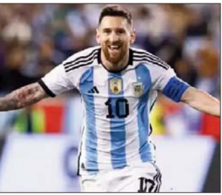
मेसी अब अपने बच्चों को अच्छी शिक्षा और तैयारी के महत्व के बारे में लगातार समझाते हैं।

अर्जेंटीना के वर्ल्ड कप विजेता कप्तान लियोनेल मेसी ने अपने करियर और निजी जीवन से जुड़े कई अहम पहलुओं पर खुलकर बात की है। एक मैक्सिकन पॉडकास्ट के दौरान मेसी ने स्वीकार किया कि बचपन में अंग्रेजी न सीख पाना उन्हें अब भी खलता है। 38 वर्षीय मेसी ने कहा, 'मुझे कई बातों का अफसोस है, लेकिन बचपन में अंग्रेजी न सीखना सबसे बड़ा पछतावा है। मेरे पास समय था, मैं पढ़ सकता था। करियर के दौरान मुझे पढ़ाया की कई बड़ी और प्रभावी हस्तियों से मिलने का मौका मिला, लेकिन भाषा की कमी के कारण मैं उनसे खुलकर संवाद नहीं कर सका। मैं ऐसे पलों में खुद को आधा अनुभूत महसूस करता था। अमेरिका के मेजर लीग सॉकर क्लब इंटर मियामी के