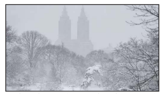
अमेरिका में भीषण बर्फबारी जारी है। सड़कें पूरी तरह बर्फ की सफेद चादर से ढक गए हैं।

वॉशिंगटन, एजेंसी अमेरिका में भीषण तेज हवाओं और भारी बर्फबारी के कारण एयरपोर्ट पर रनवे बंद करने पड़े और कई जगह उड़ानों पर रोक लगानी पड़ी है। यहां रविवार से मंगलवार के बीच 11,055 से ज्यादा उड़ानें रद्द कर दी गईं। सिर्फ सोमवार को ही करीब 5,600 से 5,700 उड़ानें कैसिल हुईं, जो देशभर की उड़ानों का लगभग 20% था। यह जानकारी फ्लाइट ट्रेकिंग कंपनी फ्लाइंगडॉट.कॉम ने दी। नेशनल वेदर सर्विस के मुताबिक, रोड आइलैंड और मैसाचुसेट्स के कुछ हिस्सों में लगभग 37 इंच तक बर्फ गिरी। बर्फबारी की वजह से उत्तर-पूर्वी राज्यों में 6 लाख से ज्यादा घरों की बिजली चली गई। सोमवार शाम तक 5 लाख 19 हजार