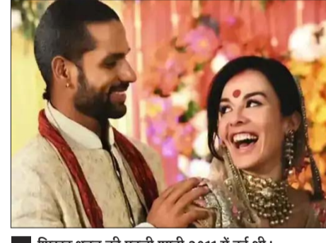
शिखर धवन की पहली शादी 2011 में हुई थी।

है। धवन और उनकी पूर्व पत्नी आयशा मुखर्जी का अक्टूबर 2023 में आधिकारिक तौर पर तलाक हुआ था। दोनों की शादी 2011 में हुई थी और यह रिश्ता करीब 11 साल चला। आयशा को पहले की शादी से दो बेटियां हैं।