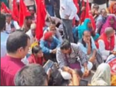
बुलडोजर चल रहा है। पुलिसिया दमन के सहारे बुलडोजर चला कर आम आदमी के दुकानों को मकान को तोड़ा जा रहा है।

लखनऊ। लखनऊ में भारतीय कम्युनिस्ट पार्टी ने जोरदार विरोध प्रदर्शन किया। भाकपा (माले) के पदाधिकारी और सदस्य प्रदेशभर से चारबाग रेलवे स्टेशन पहुंचे। विधानसभा घेराव के लिए आगे बढ़े। पुलिस उन्हें बैरिकेडिंग करके उन्हें रोक लिया। इस पर पुलिस और प्रदर्शनकारियों में तीखी नोकझोंक हुई। यूपी के 75 जिलों से कम्युनिस्ट पार्टी से जुड़े हुए पदाधिकारी और सदस्यों ने प्रदर्शन में हिस्सा लिया। बुलडोजर, बिजली का निजीकरण, किसानों को फसलों का उचित दाम और आम आम जनता से जुड़े हुए विभिन्न मुद्दों पर सरकार को घेरा।