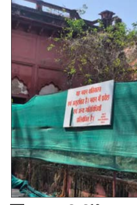
लखनऊ यूनिवर्सिटी प्रशासन ने भवन के जर्जर होने का बोर्ड लगा रखा है