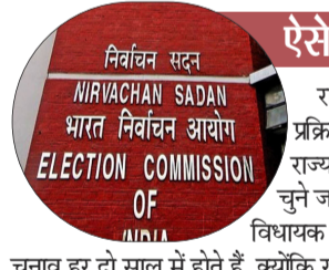
राज्यसभा सांसदों के लिए चुनाव की प्रक्रिया दूसरे चुनावों से काफी अलग है।

नई दिल्ली। चुनाव आयोग ने बुधवार को 10 राज्यों की 37 राज्यसभा सीटों पर चुनाव की तारीखों का ऐलान कर दिया।