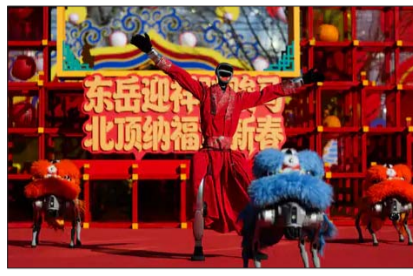
बीजिंग में आयोजित सिंग फेरिस्टवल गाला में सोमवार को प्रदर्शन करते हुए रोबोट्स।

रोबोट जैसी नई तकनीकों को दुनिया के सामने पेश करता रहा है।