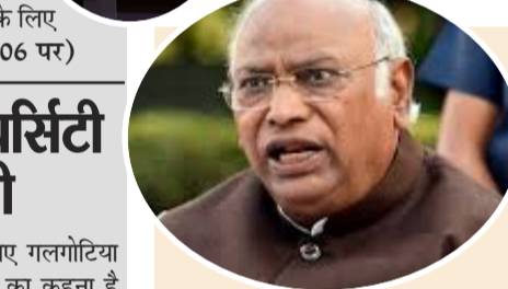
कांग्रेस अध्यक्ष मल्लिकार्जुन खड़गे ने मोदी सरकार की "पूर्ण अव्यवस्था और गंभीर कुप्रबंधन" को लेकर आलोचना की है।

AI समिट में हुई इस घटना के लिए गलगोटिया यूनिवर्सिटी माफी मांगी है। यूनिवर्सिटी का कहना है कि उनके स्टॉल पर मौजूद एक प्रतिनिधि को प्रोडक्ट के बारे में पूरी जानकारी नहीं थी।