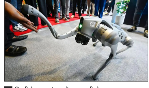
दिल्ली के भारत मंडप में 16 फरवरी से शुरू हुआ एआई इम्पैक्ट समिट 20 फरवरी तक चलेगा

चीन की खोज बताया था। चीनी रोबोट डॉग के साथ ही यूनिवर्सिटी ने कोरियन कंपनी के एक ड्रोन को भी अपना बताया था। इस पूरे मामले पर कांग्रेस ने कहा कि सरकार ने देश की इमेज खराब की है।