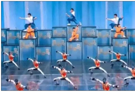
बीजिंग में आयोजित सिंग फेरिस्टवल गाला में चार चीनी कंपनियों (यूनिटी, मैजिकलेब, गलबोट और नोटिक्स) ने हिस्सा लिया था।

खास बात यह रही कि एक भी रोबोट गिरा नहीं। यह प्रदर्शन देख दुनिया हैरान रह गई। कई लोगों के मन में सवाल उठा कि अगर रोबोट अब नाच सकते हैं और कुंग फू कर सकते हैं, तो वे और क्या कर सकते हैं। एक्सपर्ट्स का मानना है कि यह प्रदर्शन पिछले साल के मुकाबले बिल्कुल अलग था। पिछले साल