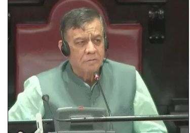
सिंचाई के लिए किसानों को मुफ्त बिजली नहीं देने का मामला उठाया। उन्होंने कहा- दो साल में 5 लाख किसानों को बाहर कर दिया गया।

लखनऊ। यूपी विधानसभा में बजट सत्र के 8वें दिन बुधवार को चर्चा जारी है।