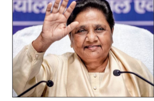
मायावती ने दिल्ली में हाल ही में अलॉट हुए 24घण्टा-8 बंगले को लेकर उठ रही अफवाहों पर सफाई दी।

लखनऊ। बसपा प्रमुख मायावती ने ऐलान किया है कि 2027 यूपी विधानसभा चुनाव उनकी पार्टी अकेले ही लड़ेगी।