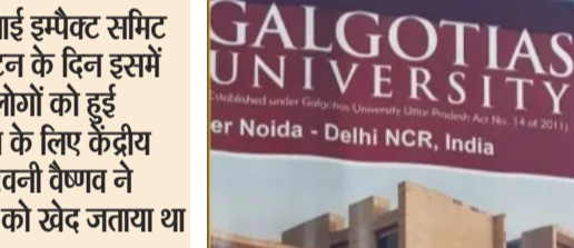
इंडिया एआई इम्पैक्ट समिट के उद्घाटन के दिन इसमें शामिल लोगों को हुई असुविधा के लिए केंद्रीय मंत्री अश्विनी वैष्णव ने मंगलवार को खेद जताया था