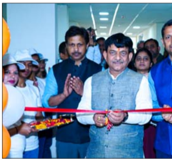
जानकारी के अभाव में कोई युवा अवसर से वंचित नहीं रहेगा तकनीक से जुड़ेगा युवा भविष्य, कौशल कॉल सेंटर बनेगा सशक्त सेतु 30 सदस्यीय टीम करेगी फॉलोअप और प्लेसमेंट की नियमित मॉनिटरिंग