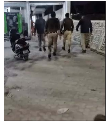
वीडियो सामने आने के बाद पुलिस ने स्पा सेंटर पहुंचकर पड़ताल की। लेकिन वहां कोई नहीं मिला।