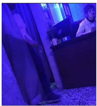
स्पा सेंटर में रिसेप्शनिस्ट के कहने पर वहां की लड़कियों ने परेड की।

बरेली। बरेली में स्पा सेंटर की आड़ में सेक्स रैकेट चलाने का मामला सामने आया है। हिंदू जागरण मंच के पदाधिकारियों का कहना है कि स्पा सेंटर की रिसेप्शनिस्ट ने 1000 रूपए में लड़कियों से थैरेपी का ऑफर दिया। पर्सद करने के लिए लड़कियों की परेड कराई। कहा-हमारे यहां पूरी सेवा होगी। उन्होंने इसका स्टिंग वीडियो भी बनाया। हिंदू संगठन ने मंगलवार को SSP से इसकी शिकायत की। इसके बाद पुलिस वहां पहुंची। स्पा सेंटर में छानबीन की गई, लेकिन वहां कोई नहीं मिला। पुलिस अब वीडियो के आधार पर आगे की जांच कर रही है। मामला बारादरी थाना क्षेत्र का है। बारादरी थाना क्षेत्र में पीलीभीत