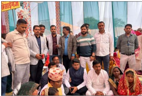
अधिकारियों एवं जनप्रतिनिधियों ने किया कन्यादान