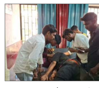
तमसा संकेत, संवाददाता

सुरतगंज (बाराबंकी)। फतेहपुर कस्बे के सुरतगंज रोड स्थित राजकीय बालिका इंटर कॉलेज के पास मंगलवार को मधुमक्खियों के अचानक हमले से इलाके में हड़कंप मच गया। इस घटना में दो छात्रों समेत कुल पांच लोग गंभीर रूप से घायल हो गए। सभी घायलों को तत्काल एंबुलेंस की मदद से अस्पताल पहुंचाया गया, जहां उनका इलाज जारी है। प्रत्यक्षदर्शियों के अनुसार पास ही