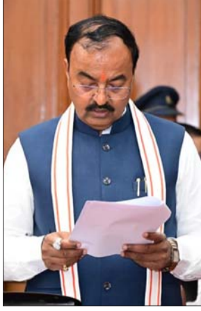
अस्पतालों का मेडिकल कॉलेजों में विलय हुआ है, उनके अलावा पीएचसी, सीएचसी और अन्य जिला अस्पतालों में सुविधाएं

लखनऊ। उत्तर प्रदेश के उप मुख्यमंत्री व विधान परिषद में नेता सदन श्री केशव प्रसाद मौर्य ने लखनऊ में विधान परिषद के बजट सत्र 2026-27 के दौरान सोमवार को उत्तर प्रदेश की स्वास्थ्य सेवाओं में सुधार और सरकारी नीतियों के बारे में विस्तार से जानकारी दी। उत्तर प्रदेश में चिकित्सा एवं स्वास्थ्य सेवाओं के ढांचा, डाक्टरों व पैरा मेडिकल स्टाफ के बारे में जानकारी देते हुए कहा कि प्रदेश में डॉक्टरों की संख्या बढ़ाने पर जोर दिया जा रहा है। जिन जिला