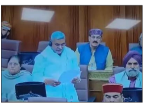
के खिलाफ आई जांच रिपोर्ट बेहद गंभीर है। उनके अनुसार मुख्य विकास अधिकारी की जांच में सीएमओ को दोषी पाया गया है, लेकिन इसके बावजूद अब तक कोई ठोस कार्रवाई नहीं हुई है। उन्होंने कार्रवाई में देरी पर सवाल उठाया। एमएलसी ने सदन को बताया कि मुख्य विकास अधिकारी का 7