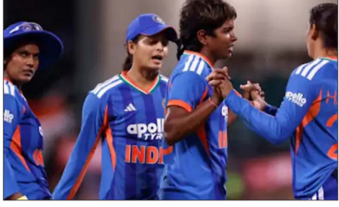
अरुंधति रेड्डी ने करियर का सर्वश्रेष्ठ प्रदर्शन करते हुए ऑस्ट्रेलिया के खिलाफ टी-20 मैच में 22 रन देकर 4 विकेट लिए।

नई दिल्ली, एजेंसी भारतीय महिला क्रिकेट टीम ने 15 फरवरी 2026 को ऑस्ट्रेलिया के खिलाफ पहले टी-20 मैच में डकवर्थ-लुईस (DLS) नियम के तहत 21 रनों से जीत दर्ज की। सिडनी में खेले गए मैच में बारिश के कारण जब खेल रोका गया, उस समय भारत लक्ष्य का पीछा करते हुए 5.1 ओवर में 1 विकेट के नुकसान पर 50 रन बना चुका था। उस समय DLS के अनुसार भारत को जीत के लिए 29 रन तक पहुंचना जरूरी था। भारतीय टीम इस पार स्कोर से 21 रन