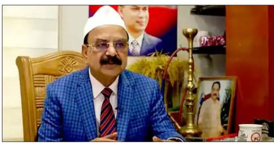
गोयेश्वर चंद्र रॉय को तारीक रहमान की कैबिनेट में मंत्री बनाया जा सकता है।

संविधान के अनुच्छेद 148 के मुताबिक, आधिकारिक नतीजे आने के तीन दिन के भीतर निर्वाचित प्रतिनिधियों को शपथ लेनी होती है। 13वें संसदीय चुनाव के निर्वाचित सदस्य मंगलवार को शपथ लेगे,