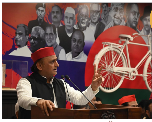
अखिलेश यादव बोले- भाजपा की एक गुप्त बैठक हुई थी, जिसमें तय हुआ कि सपा का वोट कैसे कटवाना है

तमसा संकेत, लखनऊ । समाजवादी पार्टी मुख्यालय में आयोजित प्रेस कॉन्फ्रेंस में पार्टी के राष्ट्रीय अध्यक्ष एवं पूर्व मुख्यमंत्री अखिलेश यादव ने भाजपा पर गंभीर आरोप लगाए। उन्होंने कहा कि 2027 के विधानसभा चुनाव में हार की आशंका से घबराई भाजपा समाजवादी पार्टी और पीडीए समर्थकों के वोट कटवाने के लिए फार्म-7 का दुरुपयोग कर रही है। उनका आरोप है कि यह पूरा खेल बढ़ती महंगाई, बेरोजगारी और भ्रष्टाचार जैसे मुद्दों से ध्यान भटकाने की साजिश है।