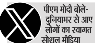
पीएम मोदी बोले- दुनियाभर से आए लोगों का स्वागत सोशल मीडिया प्लेटफॉर्म एक्स पर एक पोस्ट में पीएम मोदी ने लिखा कि आज से दिल्ली के भारत मंडप में 'इंडिया एआई इम्पैक्ट समिट' शुरू हो रही है। मैं इस समिट में हिस्सा लेने आए दुनिया भर के नेताओं, बड़े बिजनेसमैन, इन्वेंटर्स, पॉलिसी बनाने वालों, रिसर्चर्स और टेक्नोलॉजी के जानकारों का दिल से स्वागत करता हूँ।