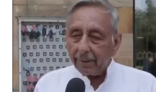
अय्यर बोले- केरल में कांग्रेस नहीं जीतेगी इंडिया ब्लॉक के लिए स्टालिन सबसे बेहतर

अगले विदेश मंत्री बनना चाहते हैं। अय्यर ने पवन खेड़ा को प्रवक्ता की जगह 'तोता' बताया। उन्होंने कहा- पवन खेड़ा वही दोहराते हैं, जो जयराम रमेश उन्हें बताते हैं। >> (शेष पेज 06 पर)