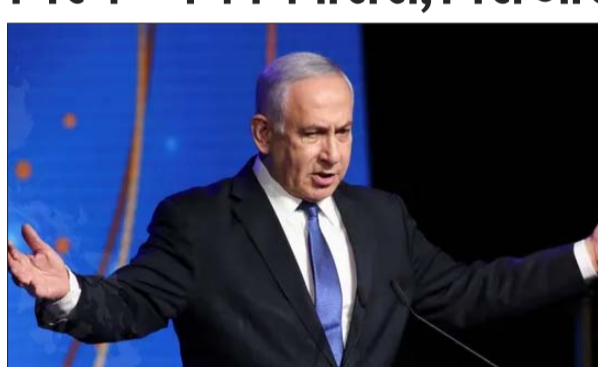
फाइनेंस मिनिस्टर बेजालेल स्मोट्रिच, जिस्टिस मिनिस्टर यारिव लेविन और डिफेंस मिनिस्टर इजरायल कोटज ने पेश किया था। स्मोट्रिच के मुताबिक, यह नया बिल इजरायल सरकार की वेस्ट बैंक इलाके में बस्तियों को बढ़ाने की कोशिश का हिस्सा है। इस बिल के तहत, इजरायल कब्जे वाले वेस्ट बैंक में जमीन के मालिकाना हक के सेटलमेंट का प्रोसेस फिर से शुरू करेगा, यह प्रोसेस 1967 में छह दिन

इजरायल ने वेस्ट बैंक को स्टेट प्रॉपर्टी बनाने की योजना को मंजूरी दी। नया बिल फलस्तीनी जमीन पर कब्जे का प्रयास माना जा रहा है। हजारों फलस्तीनियों को उनकी जमीन से बेदखल किया जा सकता है।