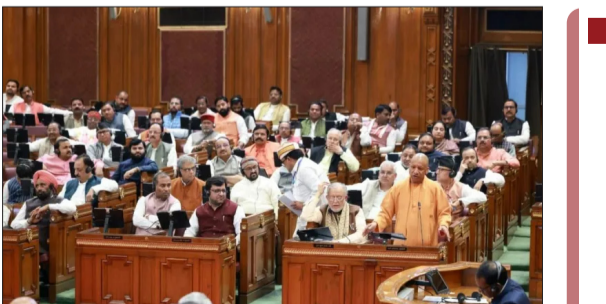
समस्या का विधिक समाधान करने का वादा किया था। उसके बाद सुप्रीम कोर्ट के आदेश से शिक्षामित्रों का सहायक अनुदेशक पद से समायोजन रद्द हो गया था। उस दौरान सरकार ने शिक्षामित्रों का मानदेय 3500 से बढ़ाकर 10 हजार रुपए महीने किया था। लेकिन, उसके बाद मानदेय में एक भी रुपए की वृद्धि नहीं की गई है। जबकि विपक्ष और विपक्ष दोनों के विधायक शिक्षामित्रों का मानदेय बढ़ाने की मांग उठाते हैं। प्रदेश में करीब 1.70 लाख आशा कार्यकर्ता हैं। >> (शेष पेज 06 पर)

तमसा संकेत, लखनऊ । यूपी विधान परिषद में सीएम योगी ने राज्यपाल के अभिभाषण पर धन्यवाद प्रस्ताव दिया। सीएम योगी ने कहा- आंगनवाड़ी, शिक्षा मित्र, अनुदेशक की सैलरी हम बढ़ाएंगे। निराश्रित महिलाओं, दिव्यांगजनों की पेंशन भी बढ़ाने जा रहे हैं। यूपी में 1.47 लाख शिक्षामित्र और 28 हजार से अधिक अनुदेशक हैं। सरकार करीब 9 साल बाद मानदेय बढ़ाने जा रही है। सूत्रों के मुताबिक शिक्षामित्रों का सहायक अनुदेशक के मानदेय में 2 हजार रुपए महीने की बढ़ोतरी हो सकती है। भाजपा ने 2017 के विधानसभा चुनाव के संकल्प पत्र में शिक्षामित्रों की