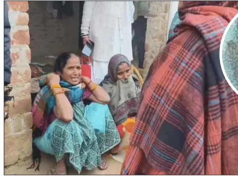
पुलिस परिजनों से घटना के बारे में पूछताछ कर रही है।

तमसा संकेत, एजेंसी श्रावस्ती। श्रावस्ती में बेटे के सामने बदमाशों ने घर में घुसकर किसान की हत्या कर दी। इसके बाद सोने-चाँदी के जेवर लूटकर फरार हो गए। परिवार के मुताबिक, रविवार रात करीब 3 बजे चार नकाबपोश बदमाश घर में घुस आए। आंख सुनकर किसान की आंख खुल गई। उन्होंने शोर मचाया और बदमाशों से भिड़ गए। आवाज सुनकर बहु और बेटा भी जा गए। बेटा दौड़कर कमरे में पहुंचा तो बदमाशों ने उसे पकड़ लिया। उसके सामने ही पिता पर चाकू से कई बार वार किए गए। यह देखकर बहु बेड के नीचे छिप गई।