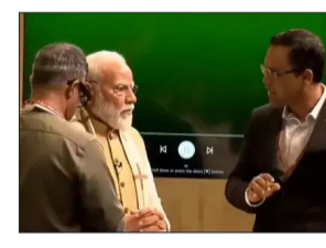
'इंडिया AI इम्पैक्ट एक्सपो 2026' का भी आयोजन किया जा रहा है। यहां दुनियाभर की कंपनियां अपने लेटेस्ट AI सॉल्यूशंस को दुनिया के सामने पेश करेंगी। ओपन AI के CEO सैम आल्टमैन: आल्टमैन ने कहा कि अमेरिका के बाद भारत चैटजीपीटी का दूसरा सबसे बड़ा उपयोगकर्ता आधार है।

नई दिल्ली । भारत में आज 16 फरवरी से दुनिया के सबसे बड़े टेक्नोलॉजी इवेंट में से एक 'इंडिया एआई इम्पैक्ट समिट 2026' शुरू हो गया है। प्रधानमंत्री नरेंद्र मोदी इसका औपचारिक उद्घाटन किया। इसके बाद उन्होंने इवेंट में शामिल हुए स्टार्टअप के पवेलियंस में जाकर उनके इन्वेंशंस की जानकारी ली। ये इवेंट 20 फरवरी तक नई दिल्ली के भारत मंडप में चलेगा। समिट के साथ-साथ