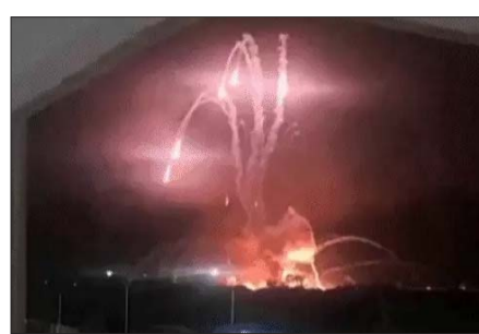
वेनेजुएला के ला ग्वाइरा पोर्ट पर 3 जनवरी को अमेरिकी सेना के हमले का फुटेज।

सैनिक की मौत नहीं हुई, लेकिन तीन हेलिकॉप्टर पायलट घायल हुए हैं। अमेरिकी सेना के पास कई सालों से 'एक्टिव डिनायल सिस्टम' नाम का एक हीट रे हथियार है। यह डायरेक्टड, पल्स्ड एनर्जी का इस्तेमाल करता है। हालांकि यह साफ नहीं है कि इस ऑपरेशन में इसका उपयोग किया गया या नहीं।