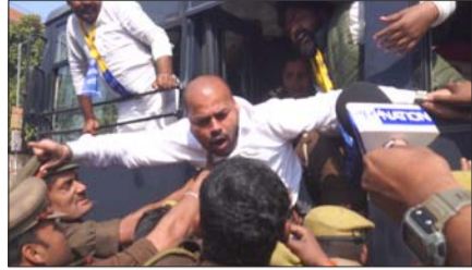
राष्ट्रपति के नाम ज्ञापन सौंपने के दौरान, ट्रंप डील के खिलाफ प्रदर्शन करते हुए आम आदमी पार्टी के कार्यकर्ताओं ने महामहिम राष्ट्रपति के नाम ज्ञापन सौंपा।