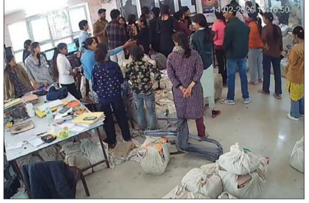
तमसा संकेत, संवाददाता

मथुरा। कोर्ट परिसर में स्थित स्कैनिंग सेंटर जिसे अक्सर फोटोकॉपी या ई-सेवा केंद्र के रूप में भी जाना जाता है, यहां मारपीट की घटना सामने आई है। विवाद यह झगड़ा मुख्य रूप से दस्तावेजों की स्कैनिंग और फोटोकॉपी के शुल्क या लाइन में लगने को लेकर शुरू हुआ, जिसने जल्द ही हिंसक रूप ले लिया। मारपीट में वहां काम करने वाले कर्मचारी और कुछ पक्षकारों या उनके सहायकों के बीच कहासुनी हुई थी। मौके पर मौजूद सुरक्षाकर्मियों और स्थानीय पुलिस ने हस्तक्षेप कर स्थिति को नियंत्रित किया। घायल पक्षों का मेडिकल परीक्षण कराया गया है। इस हंगामे के कारण कुछ समय के लिए कोर्ट परिसर में अफरा-तफरी का माहौल रहा और काम प्रभावित हुआ। वहीं पुलिस घटना की जांच और आरोपी को तलाश में जुट गई।