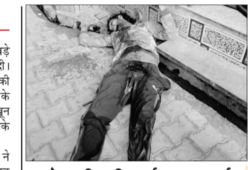
इतने वार किए कि गर्दन लटक गई

मेरठ। मेरठ के छोटे भाई ने बड़े भाई की गला काटकर हत्या कर दी। चाकू से इतने वार किए कि उसकी गर्दन कटकर लटक गई। हत्या के बाद छोटा भाई शव के पास ही खून से सना चाकू लेकर बैठा रहा। उसके चाकू से खून टपक रहा था।