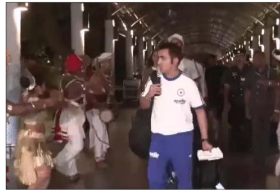
टी-20 वर्ल्ड कप में टीम इंडिया 2 मैच जीत चुकी है।

कोलंबो में मुकाबले के एक दिन पहले 14 फरवरी की सुबह 9 से दोपहर 3 बजे तक 35% बारिश के चांस हैं। शाम 6 बजे तक 25% इलाकों में बारिश हो सकती है। वहीं