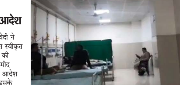
पूर्व IPS की सुरक्षा में तैनात पुलिसकर्मी।