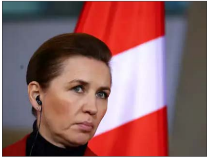
मेटे फ्रेडरिक्सन जून 2019 से डेनमार्क की प्रधानमंत्री हैं। वे डेनमार्क की सबसे युवा प्रधानमंत्री भी हैं।

ग्रीनलैंड पर कब्जे को लेकर अमेरिका और डेनमार्क के बीच विवाद का फायदा डेनिश पीएम मेटे फ्रेडरिक्सन को मिला है। अमेरिकी वेबसाइट द पोलिटिको ने लिखा है कि फ्रेडरिक्सन को राष्ट्रपति ट्रम्प को झुकाने के लिए राजनीतिक संकेत से बाहर निकाल लिया है। फ्रेडरिक्सन की पार्टी के पॉपुलैरिटी में काफी उछाल आया है। सर्वे में सोशल डेमोक्रेट्स को सिर्फ 32 सीटें मिलती दिख रही थीं। यानी