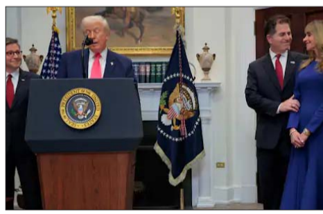
अमेरिकी राष्ट्रपति डोनाल्ड ट्रम्प ने 2 दिसंबर, 2025 को व्हाइट हाउस में डेल टेनोर्लोनीज के सीईओ माइकल डेल और उनकी पत्नी सुसान डेल के साथ ट्रम्प अकाउंट की घोषणा की।

समय के साथ यह बढ़ सके। इस योजना का लाभ उन बच्चों को मिलेगा जो 1 जनवरी 2025 से 31 दिसंबर 2028 के बीच अमेरिका में पैदा होंगे। इससे हर साल करीब 36 लाख नवजात बच्चों को फायदा होगा। इसका मकसद बच्चों को जन्म से ही वित्तीय शुरुआत देना और लंबे समय तक निवेश के जरिए धन बढ़ाना है। ताकि वे 18 साल की उम्र में पढ़ाई, बिजनेस शुरू करने, घर खरीदने या अन्य जरूरतों के लिए फंड का इस्तेमाल कर सकें।