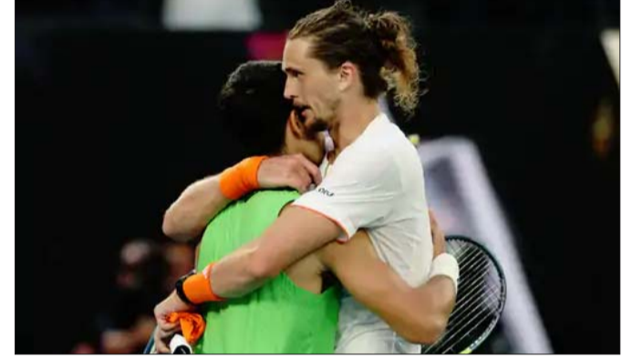
मैच के बाद अल्काराज को बधाई देते ज्वेरेव (सफेद टी-शर्ट में)।

जित के बाद अल्काराज ने कहा, मैं हमेशा कहता हूँ कि हालात चाहे जैसे भी हों, खुद पर भरोसा रखना बेहद जरूरी है। तीसरे सेट के बीच मैं मैं काफी संघर्ष कर रहा था और शारीरिक रूप से यह मेरे करियर के सबसे कठिन मुकाबलों में से एक था। उन्होंने आगे कहा, मैं पहले भी ऐसे मैच खेल चुका हूँ, इसलिए मुझे पता था कि मुझे क्या करना है। मुझे इसमें दिल-जान लगा देनी थी। मैंने ऐसा ही किया और आखिरी गेंद तक लड़ता रहा। पांचवें सेट में जिस तरह से मैंने वापसी की, उस पर मुझे खुद पर बेहद