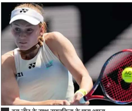
इस जीत के साथ रायबकिना के पास अपना दूसरा ग्रैंड स्लैम खिताब जीतने का मौका।

“साल के पहले ग्रैंड स्लैम ऑस्ट्रेलियन ओपन में बुधवार को बड़े उलटफेर देखने को मिले। महिला सिंगल्स के क्वार्टर फाइनल में कजाकिस्तान की एलिना रायबकिना ने शानदार प्रदर्शन करते हुए दुनिया की नंबर-1 खिलाड़ी इगा स्वियातेक को सीधे सेटों में 7-5, 6-1 से हराकर टूर्नामेंट से बाहर कर दिया। इस हार के साथ ही पोलैंड की स्वियातेक का करियर ग्रैंड स्लैम पूरा करने का सपना अधूरा रह गया। स्वियातेक अब तक चार बार फ्रेंच ओपन, एक बार विंबलडन और एक बार यूएस ओपन का खिताब जीत चुकी हैं और वह चारों ग्रैंड स्लैम जीतने वाली 11वीं महिला खिलाड़ी बनने की कोशिश में थीं।