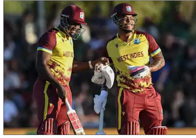
शिमरोन हेतमायर (48 रन) और रोवमैन पॉवेल ने छठे विकेट के लिए 74 रन जोड़कर स्कोर 174 तक पहुंचाया।

पहुंचाया। मैच के 14वें ओवर में हेतमायर ने केशव महाराज के ओवर में 102 मीटर लंबा