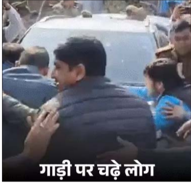
गाड़ी पर चढ़े लोग