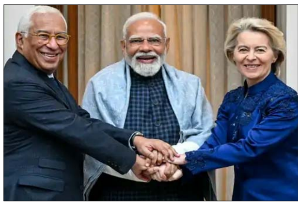
भारत और EU के बीच मंगलवार को फ्री ट्रेड एग्रीमेंट पर सहमति बनी।

भारत और यूरोपीय यूनियन (EU) के बीच हुए फ्री ट्रेड एग्रीमेंट (FTA) पर अमेरिकी ट्रेड अधिकारी जैमीसन ग्रीर ने कहा है कि इस समझौते का सबसे बड़ा फायदा भारत को मिलने वाला है। उनके मुताबिक, यह डील कई मायनों में भारत के पक्ष में झुकी हुई है। ग्रीर ने फॉक्स बिजनेस को दिए इंटरव्यू में कहा कि समझौते के लागू होने के बाद भारत को यूरोपीय बाजार में ज्यादा पहुंच मिलेगी और कुल मिलाकर भारत टॉप पर रहेगा। उन्होंने कहा, मैंने अब तक डील के कुछ डिटेल्स देखे हैं। ईमानदारी से कहूँ तो इसमें भारत को फायदा