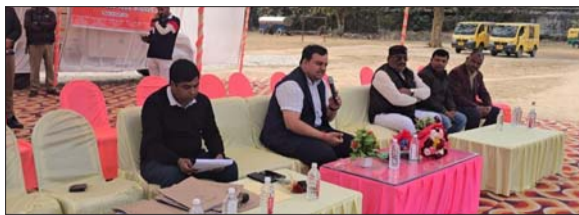
किसी भी विषय को नजरअंदाज न करने की अपील

जिलाधिकारी ने कहा कि सभी विषयों के अंक समान होते हैं, ऐसे में किसी भी विषय को नजरअंदाज करना मॉरिटे पर असर डाल सकता है। उन्होंने परीक्षार्थियों से शादी, पार्टी और जन्मदिन जैसे कार्यक्रमों से दूरी बनाकर केवल परीक्षा की तैयारी पर ध्यान केंद्रित करने को कहा। 18 फरवरी से शुरू होने वाली यूपी बोर्ड परीक्षा को लेकर उन्होंने संतकता और अनुशासन बनाए रखने की बात कही।