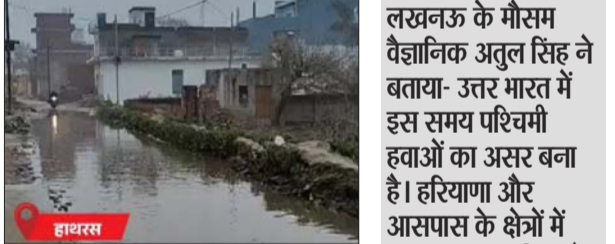
मुरादाबाद, आगरा, गाजियाबाद, नोएडा, बागपत, हाथरस, सहारनपुर और अमरौहा हैं। नोएडा में सबसे ज्यादा आधे घंटे तक ओले गिरे। लखनऊ में मौसम बदल गया। नए साल में पहली बार इतनी तेज बारिश हुई है। मंगलवार रात से शुरू हुई बारिश बुधवार सुबह तक जारी है। आसमान में बादल छाप हैं। सुबह तापमान 15 डिग्री दर्ज किया गया, जबकि नमी का स्तर लगभग 98 प्रतिशत तक पहुंच गया। 11 किलोमीटर की स्पीड से तेज हवाएं चल रही हैं। मौसम विभाग ने दिन में भी हल्की बारिश की संभावना जताई है।

लखनऊ। यूपी में एक बार फिर मौसम ने पलटी मारी है। अयोध्या-लखनऊ समेत 9 शहरों में बुधवार को बारिश हुई है। लखनऊ-कन्नौज में रातभर रुक-रुक कर बारिश होती रही, जिससे सड़कों पर पानी भर गया। संभल में कक्षा 8 तक और सिद्धार्थनगर में कक्षा 12 तक के स्कूल आज बंद कर दिए गए हैं। मौसम विभाग ने 29 जिलों में आज ओले और बारिश का अलर्ट जारी किया है। इस दौरान 20-30 की स्पीड में हवाएं चलेंगी। बारिश से पारा 3-4 डिग्री तक गिर सकता है। प्रदेश में बलिया सबसे ठंडा जिला रहा। यहां तापमान 6.1 डिग्री रिकॉर्ड किया गया। मंगलवार की बात करें तो 15 जिलों में बारिश हुई। कल देर शाम 8 जिलों में ओले भी गिरे। इसमें