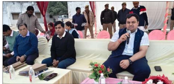
जिले के कई विद्यालयों के छात्र रहे शामिल

कार्यक्रम के दौरान विद्यार्थियों ने परीक्षा से जुड़े और व्यक्तिगत सवाल भी पूछे। एक छात्र ने व्यवसाय और नौकरी को लेकर सवाल किया, जिस पर जिलाधिकारी ने दोनों क्षेत्रों की उपयोगिता को स्पष्ट किया। वहीं, कक्षा 12 में अंग्रेजी विषय छोड़ने को लेकर पूछे गए सवाल पर बताया गया कि हिंदी माध्यम से भी प्रतियोगी परीक्षाओं की तैयारी संभव है।