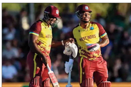
शिमरोन हेतमायर (48 रन) और रोवमैन पॉवेल ने छठे विकेट के लिए 74 रन जोड़कर स्कोर 174 तक पहुंचाया।

वेस्टइंडीज की ओर से ब्रैंडन किंग ने 14 गेंदों में 23 रन बनाए, लेकिन केशव महाराज ने जॉनसन चार्ल्स और किंग को आउट कर टीम को दबाव में डाल दिया। एक समय टीम ने 95 रन पर 5 विकेट गंवा दिए थे। इसके बाद शिमरोन हेतमायर (48 रन) और रोवमैन पॉवेल ने छठे विकेट के लिए 74 रन जोड़कर स्कोर 174 तक पहुंचाया।