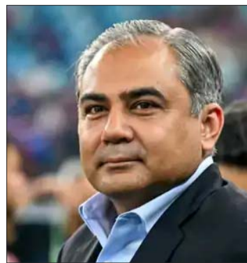
पाकिस्तान और भारत टी-20 वर्ल्ड कप के एक ही ग्रुप में हैं। दोनों 15 फरवरी को ग्रुप लीग में कोलंबो में आपस में भिड़ेंगे।

बांग्लादेश ने भारत में सुरक्षा का हवाला देते हुए अपने मैच श्रीलंका में कराने और युप बदलने की मांग की थी। गुरुवार को हुई ICC बोर्ड की मीटिंग में 16 में से 14 देशों ने बांग्लादेश की इस मांग को खारिज कर दिया था। ICC ने बांग्लादेश को फौजवादी बदले के लिए एक दिन का समय दिया था, लेकिन उनके न मानने पर उन्हें यूरोपियन टीम (स्कॉटलैंड) से रिप्लेस कर दिया गया।