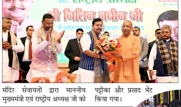
मंदिर सेवायतों द्वारा माननीय पट्टिका और प्रसाद भेंट किया गया।

मथुरा । मुख्यमंत्री योगी आदित्यनाथ एवं राष्ट्रीय अध्यक्ष नितिन नवीन ने रविवार को वृन्दावन के विश्व प्रसिद्ध श्री बांके बिहारी जी के दर पर हाजिरी लगाई। उन्होंने आराध्य के चरणों में शीश झुकाकर विधि-विधान से पूजा-अर्चना की तथा इत्र सेवा की। मंदिर के सेवायतों ने यूपी के मुख्यमंत्री और बीजेपी राष्ट्रीय अध्यक्ष को वैदिक मंत्रोच्चार के बीच पूजा करवाई। दर्शन के बाद