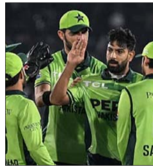
फरवरी को कोलंबो में नीदरलैंड्स के खिलाफ खेलेगी। 20 टीमों वाले इस टूर्नामेंट में हर टीम चार ग्रुप मैच खेलेगी। इसके बाद सुपर-8 और नॉकआउट स्टेज खेले जाएंगे। पाकिस्तान को ग्रुप ए में भारत के साथ रखा गया है।

टी-20 वर्ल्ड कप के लिए पाकिस्तान की टीम का ऐलान कर दिया गया है। पाकिस्तान क्रिकेट बोर्ड (PCB) ने रविवार को लाहौर के गद्दाफी स्टेडियम में प्रेस कॉन्फ्रेंस में 15 सदस्यीय टीम का ऐलान किया। इसमें PCB हाई परफॉर्मिंग डायरेक्टर और पुरुष चयन समिति के सदस्य आकिब जावेद, पाकिस्तान के T20 कप्तान सलमान अली आगा और व्हाइट-बॉल हेड कोच माइकल जेम्स हेसन मौजूद रहे। सलमान अली आगा को कप्तान बनाया गया है। जबकि बाबर आजम, फखर जमान और शाहीन शाह अफरीदी जैसे सीनियर्स को भी चुना गया है। पाकिस्तानी टीम पहला मैच 7