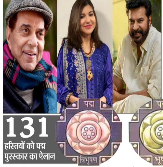
हस्तियों को पद्म पुरस्कार का एलान

नई दिल्ली । केंद्र सरकार ने गणतंत्र दिवस की पूर्व संध्या पर रविवार को 2026 के लिए 131 पद्म पुरस्कारों का एलान किया। इनमें 5 पद्म विभूषण, 13 पद्म भूषण और 113 पद्मश्री शामिल हैं। दिवंगत एक्टर धर्मेंद्र को पद्म विभूषण, झारखंड के पूर्व सीएम दिवंगत नेता शिवू सोरेन और बॉलीवुड सिंगर अलका यागिनिक को पद्म भूषण दिया जाएगा। क्रिकेटर रोहित शर्मा, पैरा एथलीट प्रवीण कुमार, महिला क्रिकेट टीम की कप्तान हरमनप्रीत कौर और हॉकी प्लेयर सविता पूनिया पद्मश्री से सम्मानित किया जाएगा।