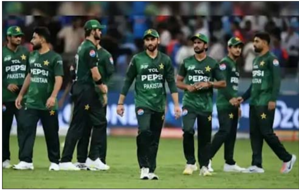
पाकिस्तान और भारत टी-20 वर्ल्ड कप के एक ही ग्रुप में हैं। दोनों 15 फरवरी को ग्रुप लीग में कोलंबो में आपस में भिड़ेंगे।

इंटरनेशनल क्रिकेट काउंसिल (ICC) ने पाकिस्तान क्रिकेट बोर्ड (PCB) को चेतावनी दी है कि अगर पाकिस्तान टी-20 वर्ल्ड कप से बाहर होता है, तो उसके खिलाफ सख्त कार्रवाई की जाएगी। एनडीटीवी की रिपोर्ट के मुताबिक, ICC बोर्ड पाकिस्तान को इंटरनेशनल क्रिकेट में पूरी तरह अलग-थलग करने की तैयारी में है। उसे भविष्य की सभी द्विपक्षीय (Bilateral) सीरीज और एशिया कप से बाहर कर सकता है। ICC बोर्ड के सदस्यों के बीच ऐसी पॉलिसी लाने पर विचार हो रहा है, जिससे विदेशी खिलाड़ी पाकिस्तान सुपर लीग (PSL) में हिस्सा न ले सकें। इसके लिए संबंधित देशों के क्रिकेट बोर्ड अपने खिलाड़ियों को नो ऑब्जेक्शन सर्टिफिकेट (NOC) देना बंद कर सकते हैं। यह विवाद तब शुरू हुआ जब PCB चीफ मोहसिन नकवी ने बांग्लादेश का समर्थन करते हुए टूर्नामेंट से हटने के संकेत दिए। दरअसल, बांग्लादेश ने सुरक्षा कारणों का हवाला देकर भारत में वर्ल्ड कप खेलेने से मना कर दिया था, जिसके बाद ICC ने शनिवार को बांग्लादेश की गवर्निंग बॉडी को शांतिपूर्ण ढंग से वापस लाने का इंतजार करने का फैसला कर दिया था। ICC ने बांग्लादेश की इस मांग को खारिज कर दिया था। ICC ने बांग्लादेश को फौजवादी बदले के लिए एक दिन का समय दिया था, लेकिन उनके न मानने पर उन्हें यूरोपियन टीम (स्कॉटलैंड) से रिप्लेस कर दिया गया।