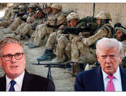
आतंकी हमले के बाद अमेरिका ने नाटो देशों से मदद ली

अफगानिस्तान युद्ध में NATO की भूमिका पर विवादित बयान के बाद अमेरिकी राष्ट्रपति डोनाल्ड ट्रम्प ने डेमिंग कंट्रोल की कोशिश की है। शनिवार को उन्होंने ब्रिटिश सैनिकों की तारीफ करते हुए अफगानिस्तान युद्ध में उनकी कुर्बानियों को याद किया। ट्रम्प ने सोशल मीडिया प्लेटफॉर्मों पर ट्विटर पर लिखा कि ब्रिटेन के महान और बेहद बहादुर सैनिक हमेशा अमेरिका के साथ रहेंगे। उन्होंने कहा कि अफगानिस्तान में 457 ब्रिटिश सैनिक मारे गए, कई गंभीर रूप से घायल हुए और वे दुनिया के सबसे महान योद्धाओं में शामिल हैं। जब उन्होंने इस हफ्ते एक इंटरव्यू में कहा था कि NATO देशों ने अफगानिस्तान में सीमित भूमिका निभाई और वे फ्रंटलाइन से दूर रहे। उनकी इस टिप्पणी से NATO के सहयोगी देशों में नाराजगी फैल गई थी। आर्टिकल 5 लागू होते ही ब्रिटेन, इटली, डेनमार्क समेत NATO के कई सदस्य और साझेदार देश अमेरिका के समर्थन में अफगानिस्तान पहुंचे।