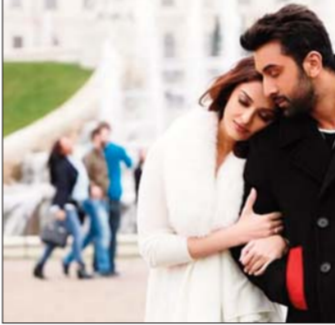
इटीमेट सीन्स को लेकर हुआ था विवाद

नई दिल्ली। बॉलीवुड की कुछ फिल्मों ऐसी होती हैं, जो अपने दमदार किरदारों और कलाकारों की वजह से दर्शकों के दिलों में खास जगह बना लेती हैं। साल 2016 में रिलीज हुई फिल्म 'ऐ दिल है मुश्किल' भी ऐसी ही एक यादगार फिल्म रही, जिसे लेकर अब फिल्ममेकर करण जौहर ने बड़ा खुलासा किया है। करण जौहर ने बताया कि यह फिल्म ऐश्वर्या राय बच्चन के बिना बन ही नहीं सकती थी। अगर ऐश्वर्या इस फिल्म के लिए मना कर देतीं, तो वह इस प्रोजेक्ट को आगे नहीं बढ़ाते। 'ऐ दिल है मुश्किल' ने रिलीज के बाद बॉक्स ऑफिस पर शानदार प्रदर्शन किया था। फिल्म को दर्शकों का खूब प्यार मिला और यह सुपरहिट साबित हुई। फिल्म में रणवीर कपूर, अनुष्का शर्मा और ऐश्वर्या राय की केमिस्ट्री को काफी सराहा गया था। इस वजह से बाद सोशल मीडिया पर काफी प्रतिक्रिया देखने को मिली थी।