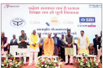
पहले नीयत साफ नहीं थी, आज व्यवस्था जवाबदेह है

तमसा संकेत, एजेंसी लखनऊ। सीएम योगी ने लखनऊ में कहा कि जिस प्रदेश का मुखिया 12 बजे सोकर उठता होगा, उसके लिए कोई सूर्योदय की बात करते तो वह सपना मानेगा।