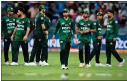
पाकिस्तान और भारत टी-20 वर्ल्ड कप के एक ही ग्रुप में हैं। दोनों 15 फरवरी को ग्रुप लीग में कोलंबो में आपस में भिड़ेंगे।

इंटरनेशनल क्रिकेट काउंसिल (ICC) ने पाकिस्तान क्रिकेट बोर्ड (PCB) को चेतावनी दी है कि अगर पाकिस्तान टी-20 वर्ल्ड कप से बाहर होता है, तो उसके खिलाफ सख्त कार्रवाई की जाएगी। एनडीटीवी की रिपोर्ट के मुताबिक, ICC बोर्ड पाकिस्तान को इंटरनेशनल क्रिकेट में पूरी तरह अलग-थलग करने की तैयारी में है। उसे भविष्य की सभी द्विपक्षीय (Bilateral) सीरीज और एशिया कप से बाहर कर सकता है। ICC बोर्ड के सदस्यों के बीच ऐसी पॉलिसी लाने पर विचार हो रहा है, जिससे विदेशी खिलाड़ी पाकिस्तान सुपर लीग (PSL) में हिस्सा न ले सकें। इसके लिए संबंधित देशों के क्रिकेट बोर्ड अपने खिलाड़ियों को नो ऑब्जेक्शन सर्टिफिकेट (NOC) देना बंद कर सकते हैं। यह विवाद तब शुरू