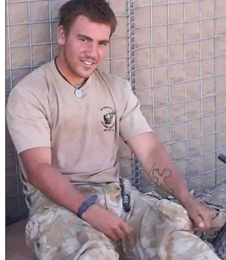
नाटो ने अफगानिस्तान में दो अभियान चलाए थे

अफगानिस्तान में NATO के तहत मुख्य रूप से दो बड़े अभियान चले, जिनमें ब्रिटेन, कनाडा, जर्मनी, फ्रांस, पोलैंड, डेनमार्क सहित दर्जनों देशों के हजारों सैनिकों ने हिस्सा लिया। पहला और सबसे बड़ा अभियान अंतर्राष्ट्रीय सुरक्षा सहायता बल (ISAF) था, जो 2001 से 2014 तक चला। इसे संयुक्त राष्ट्र सुरक्षा परिषद के आदेश पर शुरू किया गया और 2003 से नाटो ने इसका नेतृत्व संभाला।