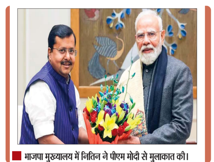
भाजपा मुख्यालय में नितिन ने पीएम मोदी से मुलाकात की।

नितिन नबीन मंगलवार को भाजपा के 12वें राष्ट्रीय अध्यक्ष बने गए। नई दिल्ली में भाजपा मुख्यालय में उनके नाम का ऐलान किया गया। वे 14 दिसंबर 2025 को कार्यकारी अध्यक्ष बने थे। सोमवार को फुल टाइम अध्यक्ष पद के लिए इकलौता नामांकन आने पर वे निर्विरोध चुने गए। कार्यक्रम में PM मोदी ने उन्हें माला पहनाई, फिर 55 मिनट के भाषण में कहा, 'मैं BJP का कार्यकर्ता हूँ। मैं मानता हूँ कि नितिनजी मेरे बाँस हैं। अब वे मेरे काम का आकलन करेंगे।' बतौर अध्यक्ष नितिन नबीन ने पहले भाषण में कहा, 'राष्ट्रीय अध्यक्ष के रूप में मेरा निवाचन एक साधारण कार्यकर्ता को असाधारण यात्रा को मिला सम्मान है।' मोदी ने कहा, 'मैं देशभर के कार्यकर्ताओं का इसे सफल बनाने के लिए अभिनंदन करता हूँ। साथियों से बीते एक डेढ़ साल में श्यामा प्रसाद मुखर्जी, अटल जी की 100वीं जयंती, संघ की 100वीं जयंती हम मनाते रहे हैं। ये वो प्रेरणाएं हैं जो देश के लिए जीने के हमारे संकल्प को और मजबूत करती हैं। हमारा नेतृत्व परंपरा से चलता है, अनुभव से समृद्ध होता है और राष्ट्र सेवा के भाव से संगठन को आगे बढ़ाता है।' मोदी ने कहा, 'बीते कई महीनों से संगठन पर्व यानी कि पार्टी का छोटी सी ईकाई से लेकर अध्यक्ष चुनने की प्रक्रिया सौ प्रतिशत लोकतांत्रिक तरीके से चुनने की भारतीय जनता पार्टी के संविधान को आत्मा और उसमें बताई गई हर बात को ध्यान में रखकर चल रही है। पीएम मोदी ने कहा 'भारतीय जनता पार्टी के नवीन अध्यक्ष नितिन नबीन जी, हमारे पूर्व अध्यक्ष जेपी नड्डा जी, भाजपा परिवार के चरिष्ठजन देशभर से आए साथी, सबसे पहले नितिन जी को दुनिया के सबसे बड़े राजनीतिक दल का अध्यक्ष चुने जाने पर बधाई शुभकामनाएं देता हूँ।