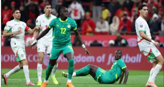
सेनेगल दूसरा खिताब जीता

लिया। अफ्रीका कप ऑफ नेशंस के इतिहास में यह पहली बार नहीं है जब बड़े मुकाबले विवादों में भिरे हों। 2010 अफ्रीका कप में टोगो टीम पर बस अटैक के बाद टूर्नामेंट की सुरक्षा व्यवस्था पर सवाल उठे थे। 2015 अफ्रीका कप में मेजबान इक्वेटोरियल गिनी पर रेफरी फैसलों