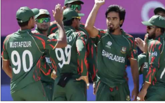
टी-20 वर्ल्ड कप की शुरुआत 7 फरवरी से होगी। बांग्लादेश को लीग के सारे मुकाबले भारत में कोलकाता और मुंबई में खेलना है।

यह एक हफ्ते में ICC और BCB के बीच दूसरी बैठक थी। इसमें