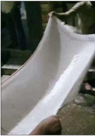
अलीगढ़ में तेज हवा के साथ बारिश हुई। रविवार शाम 7 बजे और फिर रात 11 बजे ओले गिरे।

अचानक मौसम में आए बदलाव से किसानों की मुसीबत बढ़ गई है। बारिश के साथ तेज हवाओं की वजह से फसलों पर संकट मंडराने