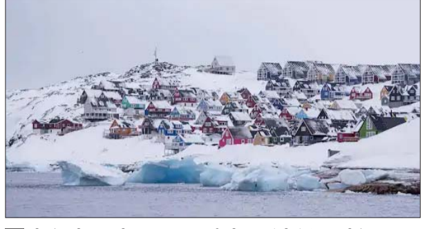
ग्रीनलैंड की राजधानी नुउक। यहां पर बर्फ की चादर तेजी से पिघल रही है। इस पिघलते हुए पानी की वजह से समुद्र में बहने वाली धाराओं की रफ्तार धीमी हो रही है।

इसी वजह से ग्रीनलैंड अब सेना, कारोबार और प्राकृतिक संसाधनों के लिहाज से पहले से कहीं ज्यादा जरूरी हो गया है। द गार्जियन की