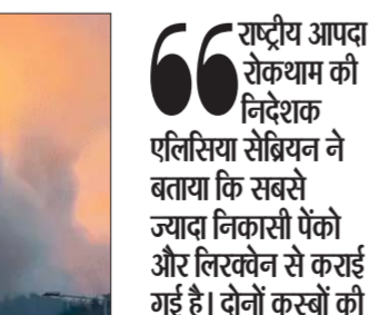
आग में कई गाड़ियां जलकर नष्ट हो गईं हैं।