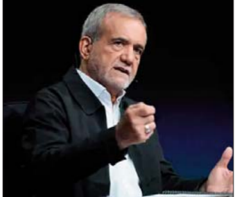
माल का नुकसान हुआ है। मानवाधिकार संगठनों के अनुसार, अब तक 3,428 प्रदर्शनकारियों को मार डाला गया, जबकि 18,000 से ज्यादा लोगों को गिरफ्तार किया जा चुका है। हालांकि संयुक्त राष्ट्र इन आंकड़ों की पुष्टि नहीं कर सका है। ईरान के निर्वासित क्राउन प्रिंस रजा पहलवी ने रविवार को कहा है।

तेहरान, एजेंसी ईरान के राष्ट्रपति मसूद पजशकियान ने अमेरिका को चेतावनी दी है कि अगर सुप्रिम लीडर अयातुल्ला अली खामेनेई पर हमला हुआ, तो ईरान के खिलाफ जंग माना जाएगा। ईरान में 28 दिसंबर से जारी हिंसक प्रदर्शनों में अब तक 5,000 लोगों की मौत हो गई है। इनमें करीब 500 सुरक्षाकर्मी शामिल हैं। एक ईरानी अधिकारी ने नाम न बताने की शर्त पर रॉयटर्स को यह जानकारी दी है। ट्रम्प ने 15 जनवरी को बताया था कि हत्याएं अब कम हो रही हैं। ज़ाइट हाउस ने भी दावा किया कि ट्रम्प के दबाव के बाद ईरान ने 800 लोगों की फांसी की योजना रोक दी है। संयुक्त राष्ट्र की सहायक महासचिव मार्था पोबी ने परिषद को बताया कि ये प्रदर्शन तेजी से फैले। इसमें काफी जान-