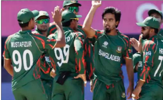
टी-20 वर्ल्ड कप की शुरुआत 7 फरवरी से होगी। बांग्लादेश को लीग के सारे मुकाबले भारत में कोलकाता और मुंबई में खेलना है।

नई दिल्ली, एजेंसी ICC ने बांग्लादेश क्रिकेट बोर्ड (BCB) को 21 जनवरी तक यह स्पष्ट करने को कहा है कि वह 2026 टी-20 वर्ल्ड कप में हिस्सा लेगा या नहीं और क्या उसकी टीम भारत आकर मैच खेलेगी। इंटरनेशनल क्रिकेट कौन्सिल (ICC) ने शनिवार (17 जनवरी) को डाका में हुई बैठक में यह समय-समय बांग्लादेश क्रिकेट बोर्ड (BCB) को बताया है। यह एक हफ्ते में ICC और BCB के बीच दूसरी बैठक थी। इसमें BCB ने साफ किया कि वह टी-20 वर्ल्ड कप खेलना चाहता है, लेकिन भारत के बाहर। BCB का कहना है कि भारत में खेलने को लेकर टीम की सुरक्षा को लेकर चिंता है। BCB ने सुझाव दिया कि टूर्नामेंट के को-होस्ट