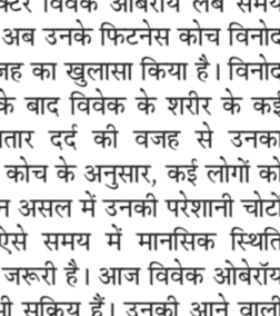
बताया कि एक्टर किस वजह से लंबे समय तक इंडस्ट्री से दूर रहे विवेक ओबेरॉय के ट्रेनर ने उनके एक्सीडेंट का किया खुलासा