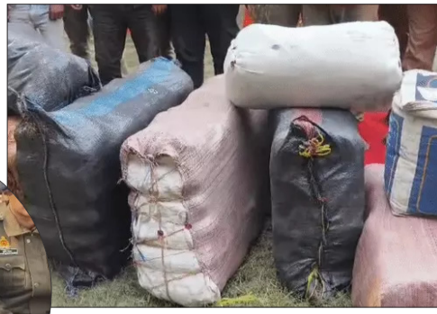
पकड़े गए तस्क़रों के पास से बरामद गांजा

गांजा की खेप आती थी। जहां से छोटी-छोटी पुड़िया