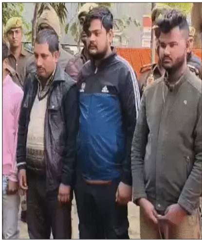
जानकारी पर नारकोटिक्स की टीम ने आरोपियों की पूछताछ की। तस्क़रों ने बताया कि वह उड़ीसा, नेपाल से बक्सों और ट्रकों से गांजा लेकर आते थे और मध्य प्रदेश, यूपी समेत तमाम राज्यों में

कानपुर। कानपुर में मादक पदार्थों के खिलाफ चलाए जा रहे अभियान में कमिश्नरेट पुलिस के हाथ बड़ी सफलता लगी है। सजेती और किरदवाँ नगर पुलिस ने शहर में मादक पदार्थों की सप्लाई करने वाली महिला समेत 5 तस्क़रों को गिरफ्तार किया। आरोपियों के पास से 2.50 करोड़ से अधिक लागत का गांजा बरामद किया गया। इतना ही नहीं पुलिस ने जब गांजा तस्क़रों के घरों में छापेमारी की, तो बक्सों में हजारों सिक्के और नोटों की गड़िड़ियाँ जमा मिली। जिनको गिनने में पुलिस को 6 घंटे का समय लगा। बड़े पैमाने पर हुई बरामदगी की