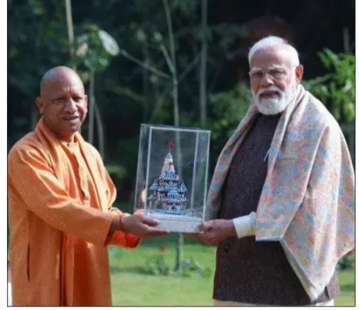
योगी ने दिल्ली में पीएम मोदी से मुलाकात की। उन्हें राम मंदिर का प्रतीक चिह्न भेंट किया। इस दौरान योगी के पास एक फाइल ने सभी का ध्यान खींचा।

लखनऊ/नई दिल्ली। सीएम योगी सोमवार को दिल्ली दौरे पर हैं। यहां उन्होंने पीएम मोदी से मुलाकात की। योगी ने मोदी को राम मंदिर का प्रतीक चिह्न भेंट किया। दोनों के बीच करीब एक घंटे तक मुलाकात हुई। बैठक के दौरान योगी के पास एक फाइल दिखाई। माना जा रहा है कि इसमें यूपी में SIR के आंकड़े थे। सूत्रों के मुताबिक, दोनों के बीच SIR और प्रदेश सरकार के आगामी कामकाज को लेकर बात हुई। योगी ने पीएम को SIR के बारे में विस्तार से जानकारी दी। पीएम को जेवर एयरपोर्ट और गंगा एक्सप्रेस-वे के लोकार्पण समारोह और अगले महीने संभावित ग्राउंड ब्रेकिंग सेमिनी का न्योता भी दिया। सीएम ने केंद्रीय