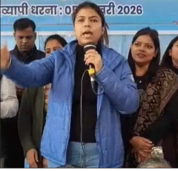
प्रदर्शनकारियों ने सरकार के खिलाफ नारेबाजी की।

मांगों को लेकर लगातार जिम्मेदार अधिकारियों से मुलाकात कर रहे हैं, मगर कोई भी सुनवाई नहीं हो रही