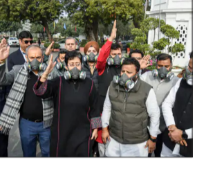
सस्पेंड कर दिया गया। (शेष पेज 06 पर)

नई दिल्ली। दिल्ली विधानसभा का शीतकालीन सत्र सोमवार को उपराज्यपाल वीके सक्सेना के अभिभाषण के साथ शुरू हुआ। इस दौरान आम आदमी पार्टी (AAP) के विधायकों ने हंगामा किया, जिसके बाद AAP के चार विधायकों को तीन दिन के लिए