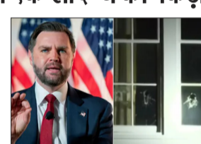
परिवार के साथ ओहियो में रहते हैं जेडी वेंस

वॉशिंगटन डीसी। अमेरिका के उपराष्ट्रपति जेडी वेंस के ओहियो राज्य के सिनसिनाटी में स्थित घर पर हमला हुआ है। CNN ने सूत्रों के हवाले से बताया कि उनके घर की खिड़कियां टूटी हैं। पुलिस ने एक संदिग्ध को हिरासत में लिया है। वेंस के घर के पास रविवार रात 12:15 बजे किसी को भागते हुए देखा गया था। अधिकारियों के मुताबिक, जिस समय यह घटना हुई, उस वक़्त जेडी वेंस और उनका परिवार घर पर मौजूद नहीं था। शुरुआती जानकारी में यह भी सामने आया है कि