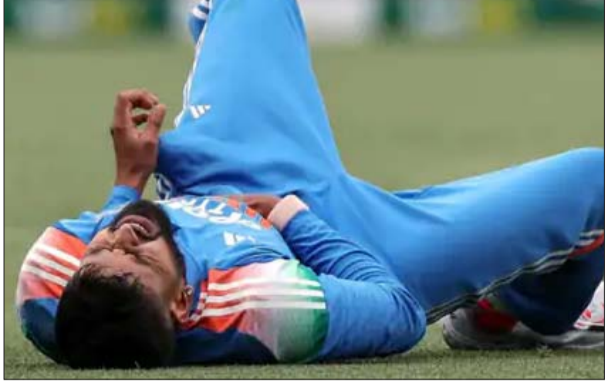
श्रेयस अय्यर को 25 अक्टूबर 2025 को ऑस्ट्रेलिया के खिलाफ सिडनी में चोट लगी थी।

रखते हुए उन्हें न्यूजीलैंड के खिलाफ होने वाली भारत बनाम न्यूजीलैंड वनडे सीरीज के लिए टीम में चुना गया है और उपकप्तान की जिम्मेदारी