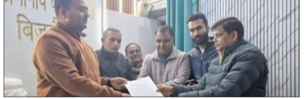
तमसा संकेत, संवाददाता

बिजनौर। मध्य गंगा नहर कॉलोनी परिसर में कार्यालय भवन निर्माण के लिए हरे-भरे पेड़ों के कटान का विरोध तेज हो गया है। कर्मचारियों ने इसके विरोध में वन विभाग और पूर्वी गंगा नहर निर्माण मंडल, बिजनौर के अधिशासी अभियंता को ज्ञापन सौंपा। वन विभाग के अधिकारियों को ज्ञापन सौंपने के दौरान कर्मचारी पेड़ों के कटाने की तैयारी देख रहे थे।