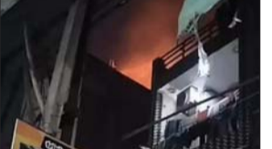
2 मीटर ऊंची उठी लपटें, लोगों में मची अफरा-तफरी, फायर टीम ने 1घंटे में काबू पाया

लखनऊ। न्यू ईयर के आखिरी दिन लखनऊ के नाका हिंडोला इलाके में अफरा-तफरी मच गई। आर्य नगर स्थित एक गोदाम में शॉर्ट सर्किट से अचानक आग लग गई, जिसके बाद गोदाम से धुएं का गुबार उठने लगा। घटना की सूचना मिलते ही पुलिस और दमकल विभाग की टीमें मौके पर पहुंच गईं और आग बुझाने का प्रयास शुरू कर दिया।