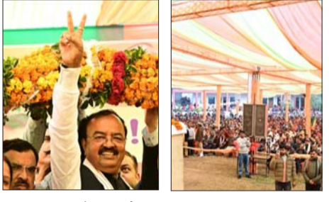
कई हजार बुजुर्गों को कंबलों का वितरण

तमसा संकेत, संवाददाता लखनऊ। कानपुर देहात की मैथा तहसील क्षेत्र अंतर्गत रामजानकी महाविद्यालय, बैरी असई परिसर में नया साल बुजुर्गों के साथ कार्यक्रम का भव्य आयोजन गुरुवार को किया गया। कार्यक्रम के मुख्य अतिथि उत्तर प्रदेश के उप मुख्यमंत्री केशव प्रसाद मौर्य ने बुजुर्गों को कंबल वितरित कर उनका आशीर्वाद प्राप्त किया तथा उपस्थित जनसमूह को नववर्ष की हार्दिक शुभकामनाएं दीं। उन्होंने अपने संबोधन में कहा कि हमारी सरकार का मूल मंत्र सेवा, सुरक्षा और संवेदनशीलता है और इसी भावना के साथ समाज के अंतिम व्यक्ति तक सरकार की योजनाओं एवं सहायता को पहुंचाने के लिए निरंतर कार्य