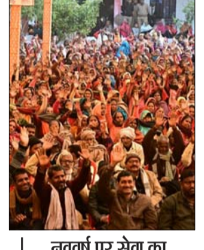
नववर्ष पर सेवा का संकल्प: उप मुख्यमंत्री केशव प्रसाद मौर्य ने बुजुर्गों को बांटे कंबल नए साल की शुरुआत बुजुर्गों के साथ-मा0 उप मुख्यमंत्री का संवेदनशील संदेश कानपुर देहात में मानवता की मिसाल, उप मुख्यमंत्री की उपस्थिति में बुजुर्गों को मिला सहारा