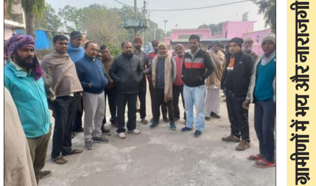
पर एकत्र हो गए। सूचना फैलते ही हिंदूवादी संगठनों के कार्यकर्ता भी मौके पर पहुंच गए और घटना को लेकर रोष व्यक्त किया। ग्रामीणों की सूचना पर पुलिस मौके पर पहुंची और हालात को संभालते हुए लोगों को शांत कराया। पुलिस अधिकारियों ने आश्वासन दिया कि दोषियों की पहचान कर उनके खिलाफ सख्त कार्रवाई की जाएगी। साथ ही ग्रामीणों के सहयोग से खंडित मूर्तियों के स्थान पर नई मूर्तियां स्थापित कराने की

बिजनौर/धामपुर। थाना क्षेत्र के गांव सरकड़ा चकराजमल में बुधवार रात एक शिव मंदिर को निशाना बनाए जाने की घटना से गांव का माहौल तनावपूर्ण हो गया। अज्ञात असाजिक तत्वों ने गांव के बाहर स्थित शिव मंदिर में घुसकर वहां स्थापित शिवलिंग और नंदी महाराज की प्रतिमा को क्षतिग्रस्त कर दिया। घटना की जानकारी गुरुवार सुबह उठत समय हुई, जब महिलाएं प्रतिदिन की तरह पूजा-अर्चना के लिए मंदिर पहुंचीं।