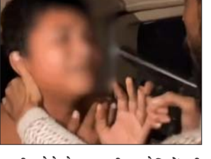
तहरीर देने के बाद भी आरोपियों की गिरफ्तारी नहीं हुई। वीडियो में दबंग गाड़ी के अंदर पिस्टल लगाकर किशोर को पीट रहे हैं। किशोर बार-बार हाथ जोड़कर माफ़ी मांग रहा है। जबरन उसके कपड़े उतरवाए जा रहे हैं। मारपीट के दौरान उसे लगातार डराया-धमकाया जा रहा है। पीड़ित ने पुलिस को बताया- दबंगों ने अवैध पिस्टल उसकी कनपटी पर सटाकर कहा कि अगर पांच लाख रुपए नहीं दिए तो जान से मार देंगे। रकम सुबह तक देने का दबाव बनाया गया। करीब चार से पांच घंटे तक बंधक बनाए रखने के बाद सुबह करीब छह बजे छोड़ दिया।

लखनऊ। लखनऊ में थर्टी फर्स्ट की रात दबंगों ने एक किशोर को अगवा कर लिया। उसे कार में डालकर सुनसान जगह ले गए। पिस्टल निकालकर उसके सिर पर लगा दिया। इसके बाद जमकर पीटाई की। इस दौरान कपड़े उतरवाकर उसे नंगा भी कर दिया। पीड़ित किशोर हाथ जोड़कर माफ़ी मांगता रहा, लेकिन दबंग उसे मारते रहे। करीब पांच घंटे तक उसे बंधक बनाकर रखा गया। घर से 5 लाख रुपए लाने को बोलकर उसे गुरुवार सुबह छह बजे छोड़ दिया गया। एक वीडियो मिला है, जिसमें दबंग पिस्टल लगाकर लड़के को पीट रहे हैं। कपड़े उतरवा रहे हैं। पीड़ित परिवार के अनुसार, राजाजी-पुरम इलाके से 31 दिसंबर की रात करीब दो बजे लड़के को घर के बाहर से जबरन चार पहिया वाहन में बैठाकर ले जाया गया। पुलिस को