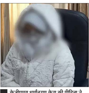
केजीएमयू धर्मतरण केस की पीड़िता ने मुख्यमंत्री योगी आदित्यनाथ से अपनी मां के साथ मुलाकात की।

इस बीच बुधवार शाम KGMU की पीड़ित डॉक्टर अपनी मां के साथ मुख्यमंत्री से मिली। मुलाकात के दौरान पीड़ित डॉक्टर ने अपनी आपबीती सुनाई। मौके पर ही सीएम ने अफसरों को तत्काल एक्शन के निर्देश देते हुए बिना देर किए आरोपी को गिरफ्तार करने के निर्देश दिए हैं। सुत्रों की माने तो मुलाकात के दौरान पीड़िता और उसकी मां द्वारा अब तक दोषी के पुलिस की गिरफ्त से दूर होने की बात कही। आप बीती सुनने के बाद मुख्यमंत्री ने नाराजगी जताते हुए बिना देर किए कार्रवाई करने की बात कही। साथ ही पीड़ित को न्याय का भरोसा दिलाया। वहीं, पीड़िता को मुख्यमंत्री से मुलाकात करने की खबर जैसे ही कैम्पस पहुंची। यहां भी माहौल गरमा गया। तमाम तरह की अटकलें लगाई जाने लगीं।