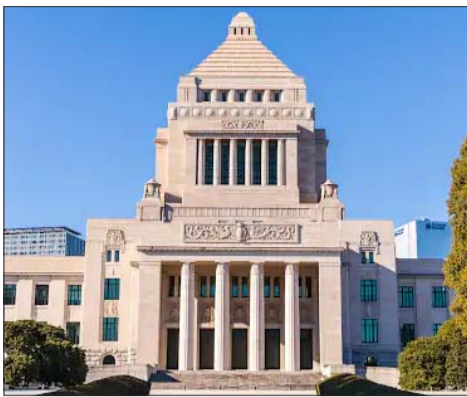
जापान की संसद की इमारत टोक्यो में है। इसका निर्माण 1936 में हुआ था। यह इमारत उस समय बनी थी, जब राजनीति में महिलाओं की भागीदारी लगभग नहीं के बराबर थी।